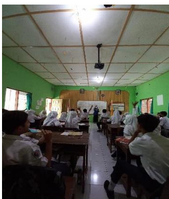
Gambar 2. Pelaksanaan Tournament Cerdas Cermat

game lebih awal, dan memilih soal tournament yang telah disediakan. Soal dikemas disajikan dalam amplop yang berwarna-warni. Anggota kelompok dipilih langsung oleh peneliti melalui nilai pretest yang telah dilakukan sebelum menerapkan model pembelajaran TGT.