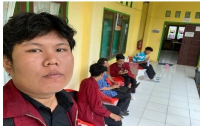
Gambar 4. Pembukaan pelaksanaan PKM

Penerimaan surat izin kepada wali murid dalam pelaksanaan kegiatan PkM di SMP NEGERI 01 BENGKULU TENGAH pada hari rabu tanggal 20 november 2024.