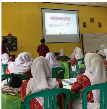
Gambar 6. Penyampaian Materi penggunaan aplikasi canva

Pembukaan kegiatan PkM di pandu langsung oleh moderator dengan membuka acara kegiatan PkM di awalai dengan salam, kata sambutan kepada siswa dan wali kelas untuk pembukaan materi yang menjelaskan tentang cara penggunaan aplikasi canva dan pelatihan canva untuk siswa/siswi SMP NEGERI 01 BENGKULU TENGAH