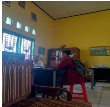
Gambar 3. Penerimaan PKM di SMPN 01 BengkuluTengah

Terhitung mulai tanggal 18 November - 21 November 2024 di smp negeri 01 Bengkulu Tengah Kecamatan Pondok Kelapa. Tahapan pencapaian target hasil pelaksanaan PKM sesuai kondisi saat ini Pada pelaksanaan, Acara ini buka oleh moderator dan selanjutnya ucapan salam kepada Wali Kelas dan para siswa Setelah itu disampaikan kata sambutan. pemateri menyampaikan tentang Pengenalan Aplikasi Canva dan Cara Mendownload Template pada Aplikasi Canva di smp negeri 01 Bengkulu tengah. Dengan kondisi yang saat ini. Kata sambutan Moderator PKM untuk mengucapkan terimakasih. atas sambutan ketua kepada wali kelas serta para siswa. Temuan ini sejalan dengan penelitian sebelumnya yang menyatakan bahwa pemanfaatan aplikasi Canva dalam pembelajaran dapat meningkatkan antusiasme dan motivasi belajar siswa(Purba & Harahap, 2022)