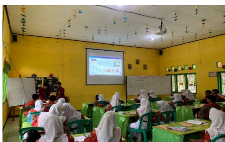
Gambar 7. Penyampaian Materi Cara Mendownload template canva

Penyampaian materi cara penggunaan aplikasi canva yang di sampaikan oleh anggota PkM, yang dimana canva banyak manfaat bagi siswa dan guru. Materi di awali dengan judul pengenalan aplikasi canva dalam pembelajaran di era digital dengan metode pembuatan template, membuat desain poster, dan konten media social.