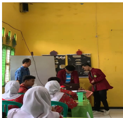
Gambar 5. Pembukaan Oleh Moderator

Pembukaan pelaksanaan PkM ini di pandu langsung kepada ketua anggota PkM kepada wali kelas, yang menjelaskan tentang materi apa saja yang akan di gunakan dan di jelaskan kepada siswa tersebut.