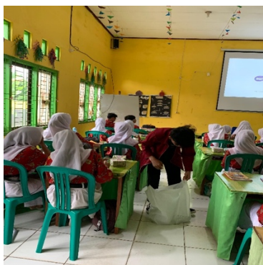
Gambar 8. Pembagian Snack Pada Siswa

Penyampaian materi cara mendwonlod templat pada aplikasi canva ,materi di awali dengan meberikan cara dan proses dalam mendwonlod template pada aplikasi canva yang dijelaskan langsung kepada anggota PkM.