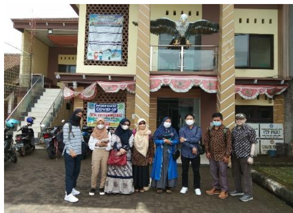
Gambar 2: Survey Pendahuluan

Berdasarkan data diatas, Tim PKM mengembangkan website pemasaran bagi pelaku UMKM di Desa Dayeuhmanggung. Websiter tersebut selain memuat profil dan potensi desa, juga memuat produk-produk UMKM unggulan beserta deskripsi dan harganya. Disediakan juga menu untuk memilih dan memeriksa biaya kirim ke tempat konsumen. Konsumen diharuskan melakukan registrasi untuk dapat berbelanja melalui website tersebut. Gambar 3 menampilkan