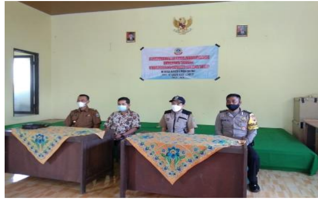
Gambar 1: Sosialisasi Kegiatan PKM