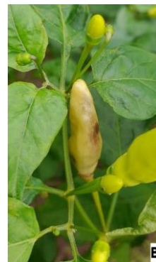
Gambar 1. Lalat buah pada tanaman cabe (A) dan cabe yang terserang (B)