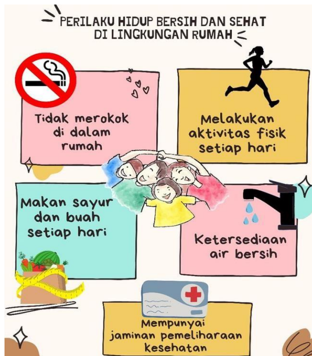
Gambar 1. Leaflet Edukasi