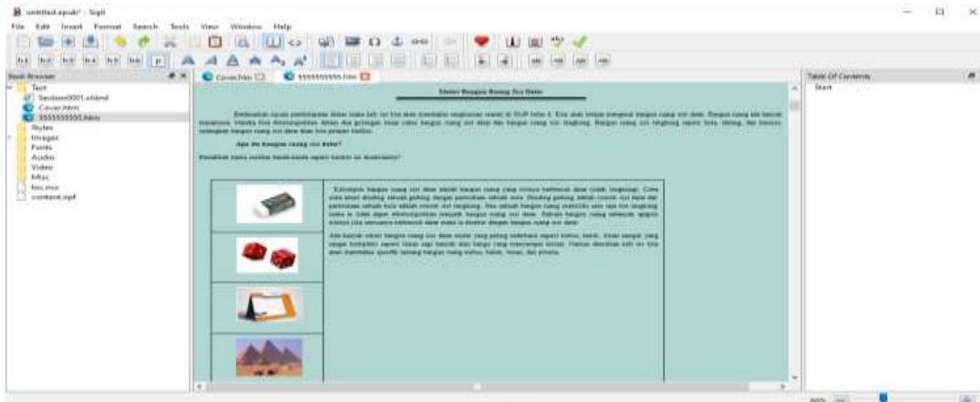
Gambar 3. Tampilan Bagian Isi E-modul

soal tentang Higher Order Thinking Skill (HOTS). Materi dan soal yang terdapat di e-modul berbasis higher order thinking skill (HOTS) diperoleh dari berbagai sumber buku maupun jurnal. Tampilan isi dapat dilihat pada gambar 3.