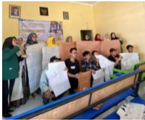
Gambar 3 Hasil pembuatan pola oleh peserta PkM