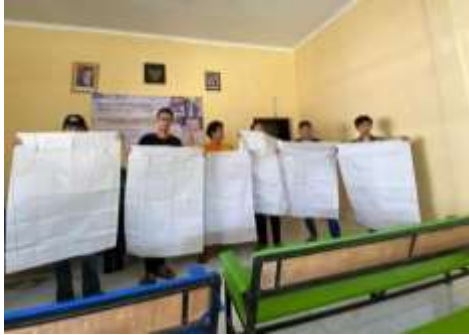
Gambar 2 Hasil pembuatan pola oleh peserta PkM