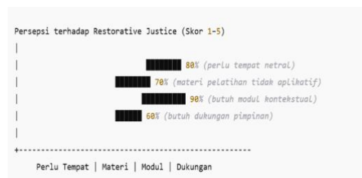
Gambar 1. Persepsi Karyawan Bersertifikat terhadap Efektivitas Restorative Justice (Diagram Batang)