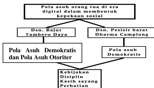
Gambar 1. Komparasi pola asuh orang tua di Dusun Pesisir Barat dan Dusun Bajur Tamberu Daya

memberikan manfaat, sehingga akan tercipta pengasuhan orang tua yang menyenangkan dan tidak membangkang maupun dibangkang.