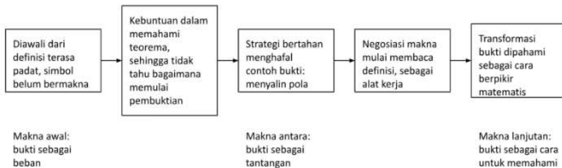
Gambar 3. Alur pemaknaan mahasiswa terhadap pembuktian

Perubahan pemaknaan terhadap bukti sebagai cara berpikir terjadi ketika mahasiswa mulai memahami pembuktian sebagai praktik memberikan alasan matematis, bukan hanya sebagai kewajiban untuk menyelesaikan tugas. Perubahan ini dimungkinkan oleh pengalaman mahasiswa dalam memahami struktur argumen, adanya dukungan dialogis selama perkuliahan, serta kesempatan untuk merefleksikan keterkaitan antara pembuktian dan tanggungjawab profesional mereka sebagai calon guru matematika. Implikasinya, dosen perlu menempatkan pembuktian sebagai praktik komunikasi matematis: mahasiswa tidak hanya diminta menulis bukti benar, tetapi juga menjelaskan alasan, mempertahankan argumen, dan menghubungkan bukti dengan cara mengajar matematika yang menumbuhkan pemahaman.