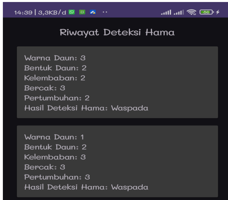
Gambar 4. Halaman Riwayat