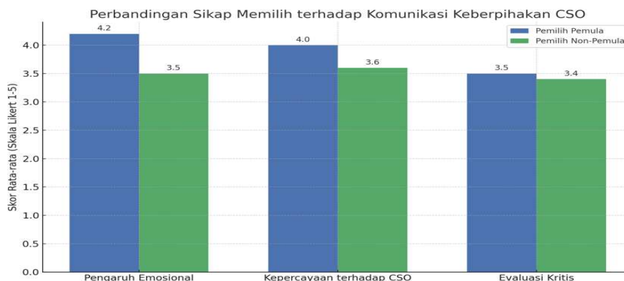
Diagram Perbandingan Sikap Memilih antara Pemilih Pemula dan Non-Pemula

Hasil penelitian ini memperlihatkan adanya perbedaan yang signifikan antara pemilih pemula dan pemilih non-pemula dalam menyikapi komunikasi keberpihakan yang dilakukan oleh Community Social Organization (CSO). Tiga dimensi utama yang diukur, yaitu pengaruh emosional, kepercayaan terhadap CSO, dan evaluasi kritis terhadap pesan, menunjukkan variasi respons yang mencerminkan perbedaan pola pikir dan pengalaman politik antar kedua kelompok.