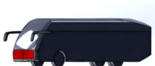
Gambar 4. Desain Bus B (Modifikasi)