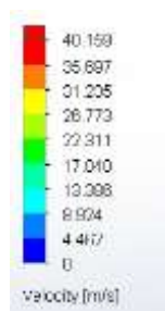
Gambar 7. Klasifikasi hasil simulasi