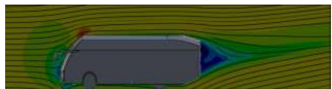
Gambar 9. Desain dan Simulasi Bus Modifikasi

Hasil simulasi pada Tabel 2 CFD pada desain bus konvensional menunjukkan nilai koefisien hambatan ( C_d ) sebesar 0,5 dengan gaya hambatan maksimum yang tercatat sebesar 1851,436 \text{ N} . Nilai ini mengindikasikan tingkat hambatan udara yang signifikan pada bodi bus konvensional, yang dapat memengaruhi efisiensi bahan bakar dan performa kendaraan secara keseluruhan. Visualisasi aliran udara pada gambar menunjukkan pola aliran dengan area turbulensi yang relatif besar di bagian belakang bus, yang berkontribusi pada peningkatan gaya hambatan. Kondisi ini konsisten dengan karakteristik aerodinamika kendaraan besar dengan desain bodi konvensional yang kurang optimal dalam mengurangi hambatan udara. Temuan ini menjadi dasar pertimbangan dalam pengembangan desain bodi bus.