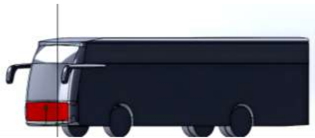
Gambar 3. Desain Bus A (Konvensional)