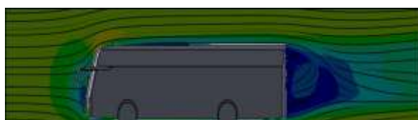
Gambar 8. Desain dan Simulasi Bus Konvensional

Dari hasil simulasi pada Gambar 8 yang sudah dilakukan maka dilanjutkan pada tahap simulasi yang didapatkan hasil sebagai berikut: