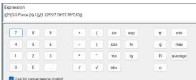
Gambar 6. Equation Perhitungan C_d Bus Modifikasi

Gambar 6 merupakan equation untuk menghitung besar C_d . Besar frontal area yang digunakan pada bus modifikasi adalah 7,63 \text{ m}^2 . Sedangkan kecepatan yang digunakan adalah 100 \text{ km/jam} atau 22,78 \text{ m/s} . Hasil pada simulasi menunjukkan ambang batas yang ditentukan dan disertakan pada Gambar 7.