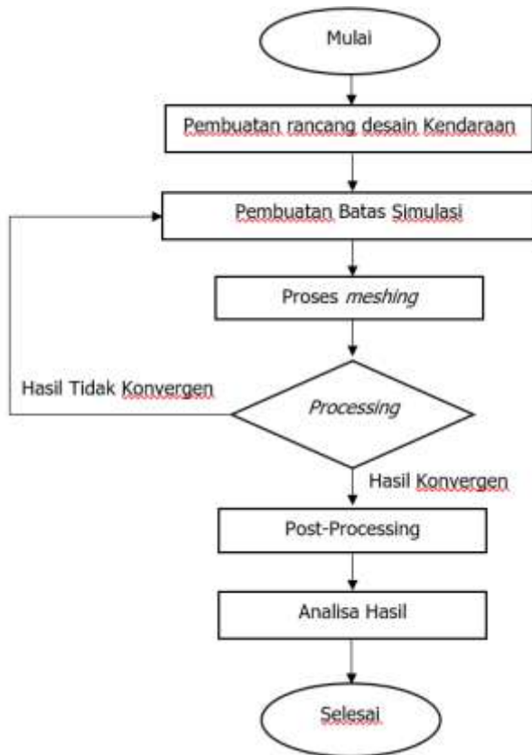
Gambar 1. Diagram Alur Penelitian

Proses tahapan penelitian yang dilakukan pada artikel ini adalah seperti diperlihatkan pada Gambar 1. Penelitian dimulai dengan kajian literatur yang komprehensif untuk mengidentifikasi konsep aerodinamika pada kendaraan bus, serta mempelajari dimensi dan komponen bodi yang relevan. Berdasarkan kajian yang ada, dirumuskan permasalahan penelitian yang fokus pada pengaruh variasi desain bodi terhadap performa aerodinamis bus. Selanjutnya, model tiga dimensi dari desain yang ada dan beberapa desain modifikasi dibuat menggunakan perangkat lunak.