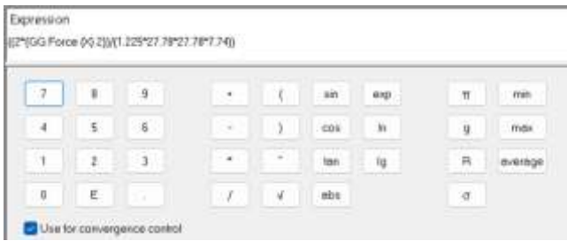
Gambar 5. Equation Perhitungan C_d Bus Konvensional

Gambar 6 merupakan equation untuk menghitung besar C_d . Besar frontal area yang digunakan pada bus modifikasi adalah 7,63 \text{ m}^2 . Sedangkan kecepatan yang digunakan adalah 100 \text{ km/jam} atau 22,78 \text{ m/s} . Hasil pada simulasi menunjukkan ambang batas yang ditentukan dan disertakan pada Gambar 7.