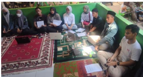
Gambar 4. Peserta PKM dari IPNU Ciledug

Kegiatan ini dilaksanakan secara hybrid yaitu online dan offline dengan membagi tugas kepada setiap Tim Pelaksana PKM sehingga interaksi dengan peserta generasi muda IPNU Ciledug dapat lebih efektif dan bersifat dialogis tanpa mengabaikan protokol kesehatan.