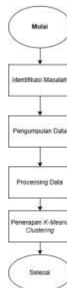
Gambar 1. Desain Penelitian

Desain penelitian untuk melakukan sentiment analisis dapat dijabarkan pada gambar 1.