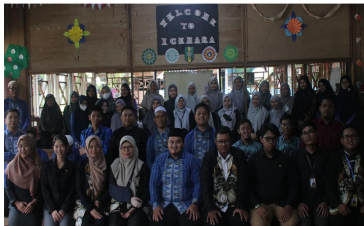
Gambar 5. Foto bersama tim dengan para peserta

Secara kuantitatif, lebih dari 80% peserta mengalami peningkatan skor pemahaman sebesar 20 poin atau lebih antara pre-test dan post-test . Dari sisi kapasitas teknis, lebih dari 75% guru berhasil menyusun RPP dan media pembelajaran berbasis AI dengan kualitas yang terkategori "baik" berdasarkan rubrik penilaian.