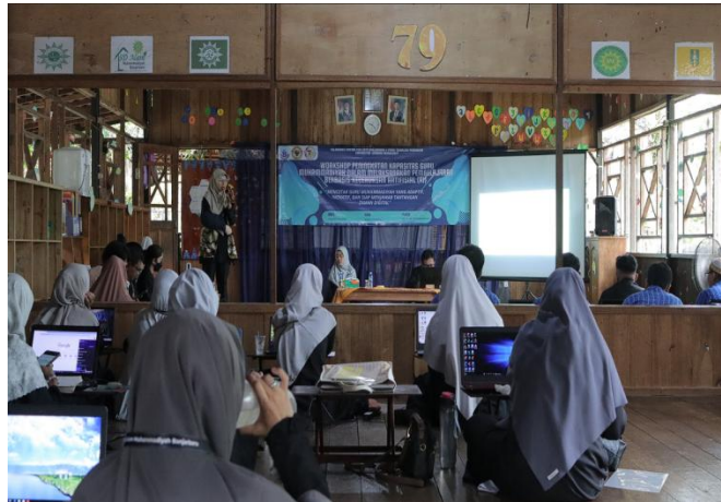
Gambar 2. Tim pelaksana melaksanakan kegiatan pelatihan dan bimbingan teknis dengan FGM Banjarbaru

bertanggung jawab atas rancangan, materi, dan fasilitasi, dengan FGM Banjarbaru yang memfasilitasi identifikasi peserta, akomodasi, dan sarana pendukung.