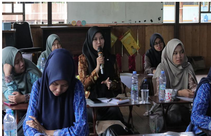
Gambar 3. Antusiasme peserta pelatihan

Kegiatan pelatihan dirancang dengan pendekatan scaffolding , yang dimulai dengan sesi penguatan pemahaman konseptual mengenai AI dan perannya dalam transformasi pendidikan. Sesi ini dilanjutkan dengan lokakarya praktik langsung ( hands-on workshop ) di mana para guru dibimbing untuk menggunakan berbagai perangkat AI generatif untuk merancang media ajar, menyusun instrumen asesmen, dan mengembangkan Rencana Pelaksanaan Pembelajaran (RPP) yang inovatif. Antusiasme peserta yang tinggi, sebagaimana teridentifikasi pada tahap refleksi, termanifestasi secara nyata melalui partisipasi aktif, diskusi interaktif, dan semangat eksplorasi selama sesi praktik berlangsung.