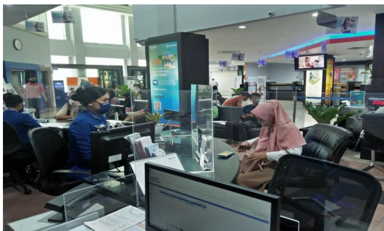
Gambar 1.4 Aplikasi BRImo terbukti efektif dalam mengurai penumpukan antrean

Nasabah yang semula tidak menggunakan aplikasi BRImo ini dan selalu bertransaksi di kantor bank, kini bisa melakukan berbagai transaksi di mana pun dan kapan pun. Hal ini tentu saja dapat mengatasi masalah yang biasa timbul pada saat kegiatan pelayanan seperti menumpuknya antrean di customer service yang seringkali menjadi keluhan nasabah.