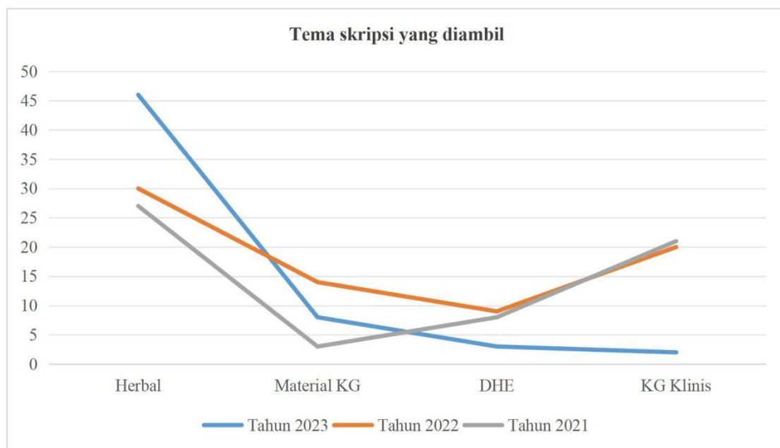
Gambar 2. Tema skripsi yang diambil oleh mahasiswa Kedokteran Gigi Unsri

Sebaran tema skripsi mahasiswa tiga tahun terakhir pada semua departemen dapat dilihat pada Gambar 2.