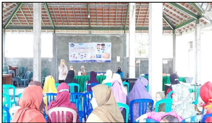
Gambar 3. Penyampaian Materi Pengabdian Masyarakat

Selama kegiatan penyampaian materi pengabdian masyarakat terlihat bapak dan ibu yang merupakan orang tua atau wali murid di KB Harapan Bunda, Desa Sambirejo Kabupaten Madiun memperhatikan dengan baik meskipun ada beberapa orang tua yang sibuk mengkondisikan anak-anaknya yang diajak dalam kegiatan tersebut. Penyampaian materi berjalan dengan baik, ada sesi tanya jawab dan diskusi untuk memperdalam pemahaman orang tua dalam pemanfaatan teknologi berupa handphone . Pada awal survei lapangan, berdasarkan hasil wawancara dengan beberapa orang tua menyampaikan jika selama pembelajaran daring, peserta didik lebih banyak menggunakan handphone dan terkadang orang tua kesulitan dalam mendampingi peserta didik saat pembelajaran daring. Orang tua juga kadang membiarkan peserta didik untuk belajar mandiri dengan handphone tanpa ada pengawasan yang ketat tentang apa yang dilihat peserta didik.