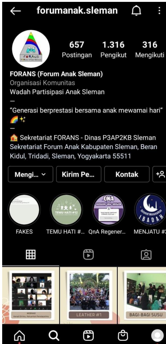
Gambar 4. Tampilan Akun Instagram Forum Anak Kabupaten Sleman

anak dan meningkatnya pengetahuan anak-anak dan remaja tentang Hak Anak. Sesuai dengan perkembangan jaman, FA Sleman menggunakan media sosial berupa Instagram dalam memberikan edukasi dan informasi kepada sasaran utama mereka yaitu anak-anak dan remaja di Kabupaten Sleman.