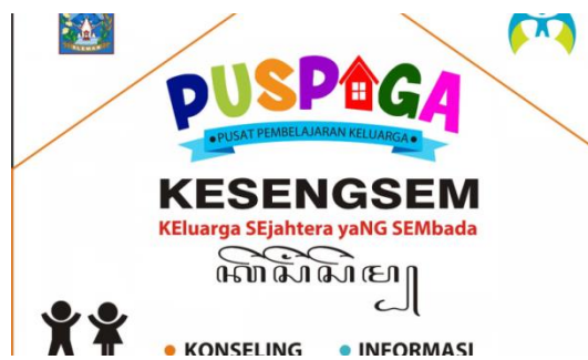
Gambar 3. Logo Puspaga Kabupaten Sleman

Menyadari bahwa implemementasi kebijakan harus sampai pada tingkat mikro/keluarga, selain adanya Forum Anak Sleman, Kabupaten Sleman juga memiliki Pusat Pembelajaran Keluarga (Puspaga) sebagai tempat pembelajaran untuk meningkatkan kualitas kehidupan menuju keluarga sejahtera yang dilakukan oleh tenaga profesi melalui peningkatan kapasitas orangtua/keluarga. Latar belakang penyebab perkawinan pada usia anak sebagian besar dikarenakan lemahnya kontrol orangtua sehingga anak memiliki pergaulan yang bebas. I 1 menyatakan bahwa Kabupaten Sleman sudah memiliki Puspaga hingga level desa, hingga saat ini sudah ada 2 desa yang memiliki Puspaga yaitu Desa Wedomartani yang ada di Kepanewon Ngemplak dan Desa Margo Agung yang ada di Kepanewon Seyegan.