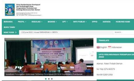
Gambar 5. Website Dinas P3AP2KB Kabupaten Sleman

Sebagai pendukung terlaksananya program, sangatlah mustahil apabila tidak membutuhkan biaya untuk memfasilitasi program tersebut agar dapat terlaksana. Sumber daya anggaran yang saat ini digunakan dalam implementasi Perbup tersebut berasal dari Dana APBD. Namun menurut penuturan I 1 , salah satu kendala anggaran untuk saat ini yaitu terkait inisiasi surat rekomendasi psikiater sebagai syarat pengajuan dispensasi nikah tersebut. Dinas P3AP2KB yang diharapkan dapat memfasilitasi hal ini masih mengalami kendala kisaran biaya konsultasi psikiater untuk syarat pengajuan dispensasi yang belum tercover BPJS.