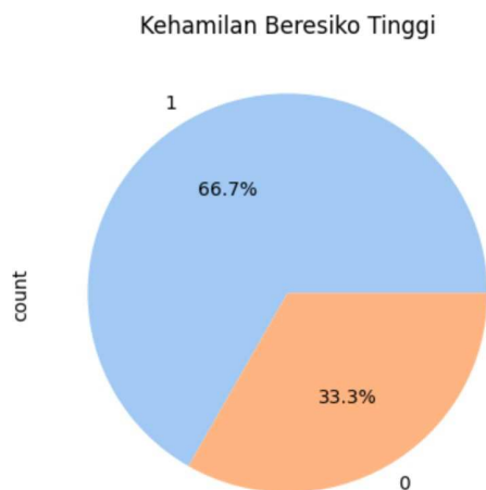
Gambar 4. Hasil Algoritma SVM

Untuk algoritma SVM, digunakan kernel Radial Basis Function (RBF) karena memiliki kemampuan memproyeksikan data ke dimensi yang lebih tinggi sehingga memudahkan pemisahan kelas yang tidak dapat dipisahkan secara linier di ruang aslinya. Model SVM dilatih menggunakan data latih dan diuji pada data uji yang belum pernah dilihat model.