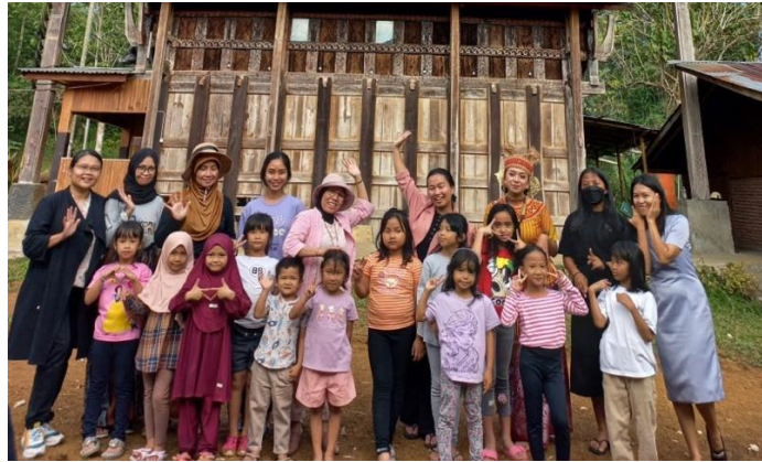
Gambar 2. Tim Peneliti bersama Anak-anak Sanggar dan Pengelola Sanggar Tari Kinawa Art Studio di Tana Toraja.

Pembelajaran menggali potensi ini tidak ada paksaan, tetapi mengalir bakat anak-anak dalam berkesenian. Tekad kuat dari para pengelola sanggar tari ini memberikan inspirasi kepada anak-anak sejak dini. Instruktur Sanggar Kinawa Art ini terdiri atas para mahasiswa jurusan Tari dan koreografer muda yang ingin mewujudkan Sanggar Tari Kinawa menjadi salah satu pusat pembinaan seni tradisi bagi generasi penerus di Tana Toraja.