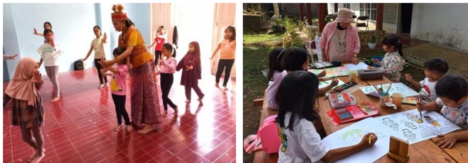
Gambar 1. Kegiatan Sanggar Tari Kinawa Art Studio, Tana Toraja, Sulawesi Selatan.

Sanggar Tari Kinawa Art Studio memiliki berbagai kegiatan yaitu pelatihan tari, seni lukis dan aktivitas seni budaya lainnya. Materi kelas tari berupa dasar-dasar gerak menari dengan kordinasi badan secara keseluruhan dari tungkai kaki, torso, lengan, dan kepala, sehingga anak-anak dapat melakukan kordinasi berbagai ragam gerak dengan baik dan benar. Sedangkan Kelas Melukis, anak-anak boleh duduk di mana saja mencari objek lukis yang disukai anak-anak. Berikut gambar tim peneliti, informan dan anggota sanggar: