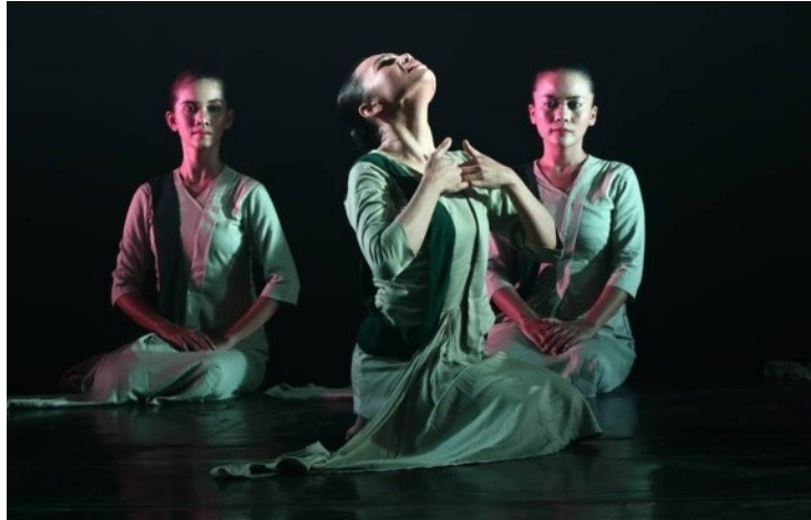
Gambar 2. Ngaji Ka Diri

Bagian tiga: Refleksi diri, harapan dan peristiwa yang terjadi saat ini, cara menyikapi kehidupan, dengan mendekatkan diri pada Tuhan, memperbaiki hubungan terhadap manusia juga terhadap lingkungan sekitar termasuk alam, gerakan pada bagian terakhir ini semakin lama tempo semakin lambat namun musik tetap ritmis dan dinamis.