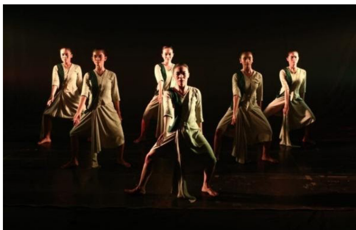
Gambar 4. Refleksi Diri (Dokumentasi: Agustina 2021)