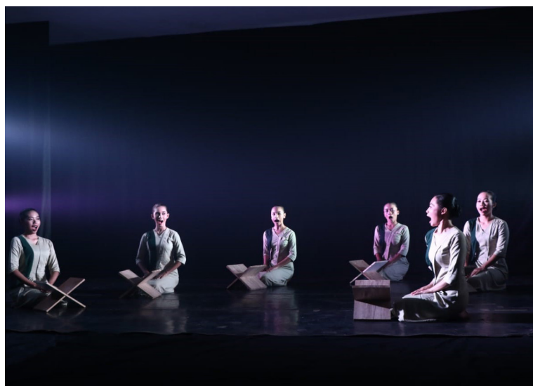
Gambar 1 Introduksi Belajar Mamaos

Introduksi: gambaran peristiwa di masa lalu ( flashback ) para penari memasuki panggung secara bergiliran yang menceritakan tentang kegiatan akan belajar mamaos , dengan berjalan masuk secara bergantian dan bertegur sapa dengan penari lainnya, kegiatan keseharian yang sedang berkomunikasi satu sama lain kemudian datang seorang penari seolah-olah sebagai guru. Lalu membuka rekam yang di mana sebagai simbol buku atau catatan teks mamaos . Penari terlebih dahulu menggerakkan kepala sebagai simbol berdoa, dan dilanjutkan menggerakkan mulut tanpa bersuara menceritakan yang sedang belajar mamaos . Penari keluar panggung satu-satu dengan memberikan motif-motif gerak yang akan hadir pada bagian selanjutnya.