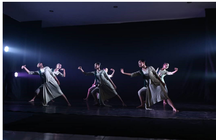
Bagian 3. Kotemplasi