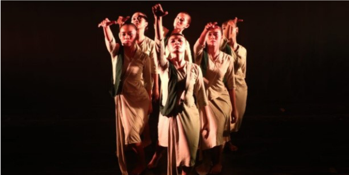
Gambar 5. Refleksi Diri