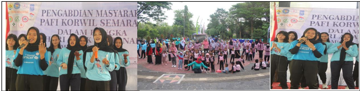
Gambar 3. Kegiatan Promotif Gerakan Cuci Tangan