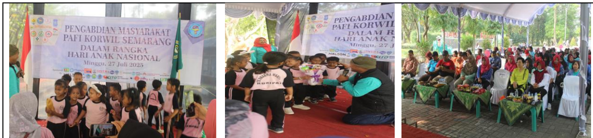
Gambar 2. Penyuluhan kepada Anak-anak

Kegiatan promotive dilakukan pada awal kegiatan, diadakan sesi edukasi kesehatan yang fokus pada penyuluhan Perilaku Hidup Bersih dan Sehat (PHBS), cara cuci tangan yang benar, serta pentingnya gizi seimbang untuk anak-anak. Materi disampaikan secara interaktif dan disertai brosur serta leaflet agar peserta lebih mudah memahami. Menurut penelitian sebelumnya, cara ini efektif dalam meningkatkan pemahaman anak (Notoatmodjo, 2012). Kegiatan promotif dalam pengabdian masyarakat ini dilaksanakan melalui penyuluhan kesehatan yang difokuskan pada peningkatan pengetahuan dan kesadaran anak-anak, remaja, serta masyarakat umum mengenai perilaku hidup bersih dan sehat (PHBS) serta gizi seimbang. Apoteker dan tenaga vokasi farmasi bertugas memberikan pemahaman tentang pentingnya menjaga kesehatan dengan memahami obat dan suplemen yang aman, cara penggunaan obat yang benar, serta cara mencegah penyakit dengan menjaga kebersihan dan kebiasaan yang sehat setelah beraktivitas. Mereka juga mengingatkan pentingnya melakukan pemeriksaan kesehatan secara rutin agar masalah kesehatan bisa terdeteksi lebih awal. Di sisi lain, PERSAGI memberikan penyuluhan yang interaktif mengenai gizi seimbang, kebutuhan nutrisi bagi anak dan remaja, serta dampak dari pola makan terhadap kesehatan jangka panjang. Materi penyuluhan disampaikan dengan menggunakan brosur, leaflet, dan simulasi interaktif agar peserta lebih mudah memahami dan termotivasi untuk menerapkannya dalam kehidupan sehari-hari.