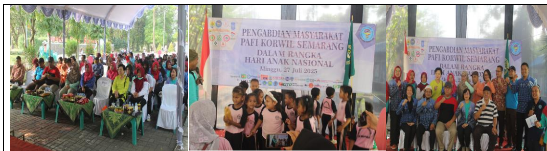
Gambar 5. Dokumentasi Kegiatan