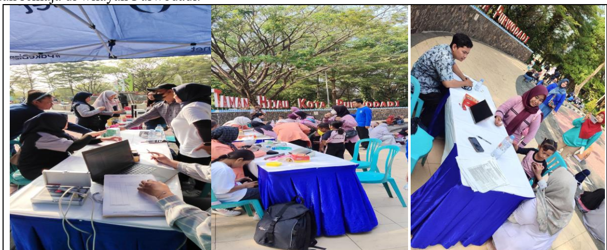
Gambar 4. Kegiatan Preventif Pemeriksaan Kesehatan