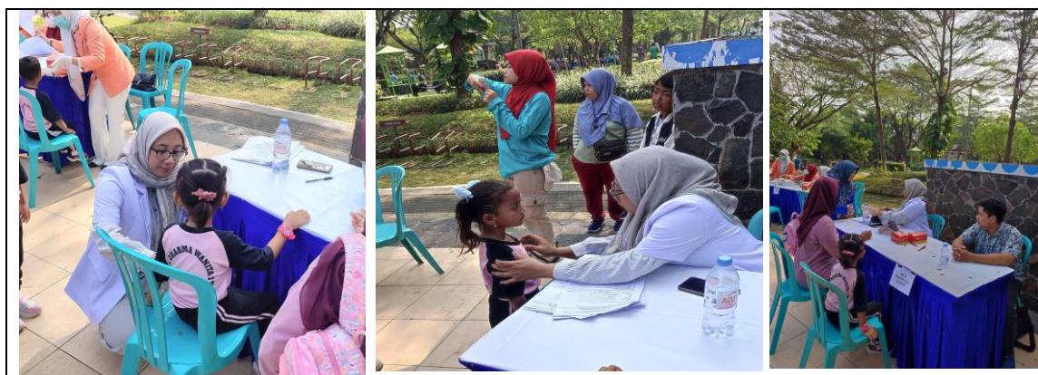
Gambar 4. Kegiatan Preventif Pemeriksaan Kesehatan

Pelaksanaan kegiatan dengan total peserta yang hadir mencapai 327 orang, terdiri dari berbagai tenaga kesehatan seperti anak-anak PAUD, TK, remaja, mahasiswa, apoteker, perawat, dokter, ahli gizi dan ahli laboratorium. Tingginya partisipasi menunjukkan antusiasme dan kepedulian masyarakat terhadap kegiatan kesehatan, serta keberhasilan kolaborasi lintas profesi. Secara keseluruhan, kegiatan ini memberikan manfaat langsung berupa peningkatan pengetahuan dan pelayanan kesehatan, serta memperkuat hubungan antarprofesi. Dengan kesuksesan yang diraih, diharapkan program sejenis dapat terus dilaksanakan untuk mendukung pencapaian tujuan pembangunan kesehatan di tingkat daerah. Pelaksanaan pengabdian masyarakat yang melibatkan berbagai sektor memiliki peran penting dalam memperluas dampak dan meningkatkan manfaat bagi masyarakat yang menjadi sasaran. Keterlibatan berbagai pihak seperti organisasi profesi (PAFI, IAI, IDI, PPNI, PERSAGI, PTGMI, PATELKI), instansi pemerintah (Dinas Kesehatan Kabupaten Grobogan), lembaga pendidikan kesehatan, serta masyarakat setempat menciptakan kerja sama yang kuat dalam menyediakan layanan kesehatan yang lengkap dan menyeluruh.