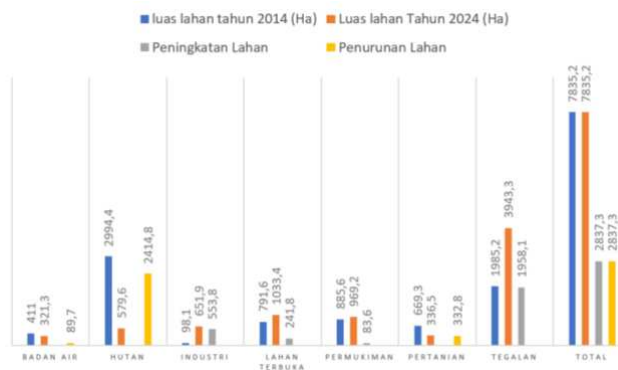
Gambar 1. Grafik Perubahan Penggunaan Lahan Kecamatan Pringapus

Selanjutnya sektor lahan terbuka pada tahun 2014 mempunyai luas lahan 791,6 Ha dan pada tahun 2024 mengalami peningkatan menjadi 1033,4 Ha, jadi total peningkatan penggunaan lahan 241,8 Ha. Selanjutnya sektor Pemukiman pada tahun 2014 mempunyai luas 885,6 Ha dan pada tahun 2024 mengalami kenaikan menjadi 969,2 Ha, jadi total kenaikannya adalah 83,6 Ha. Selanjutnya Sektor pertanian pada tahun 2014 mempunyai luas lahan 669,3 Ha dan pada tahun 2024 mengalami penurunan 336,5 Ha, dan jadi total perubahannya adalah 332,8 Ha. Selanjutnya sektor tegalan pada tahun 2014 mempunyai luas 1985,2 Ha dan pada tahun 2024 mengalami peningkatan yang sangat signifikan menjadi 3943,3 Ha, Jadi total peningkatan penggunaan lahan nya adalah 1958,1 Ha.