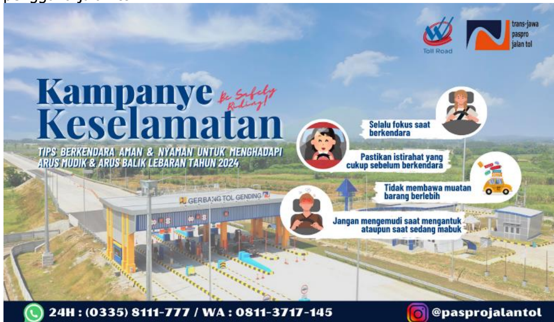
Gambar 2. Stiker Tips Berkendara Aman dan Nyaman

Pembuatan stiker ini dilakukan untuk memberikan saran atau anjuran ketika mengemudi yang aman dan nyaman selama melakukan perjalanan kepada pengguna jalan tol.