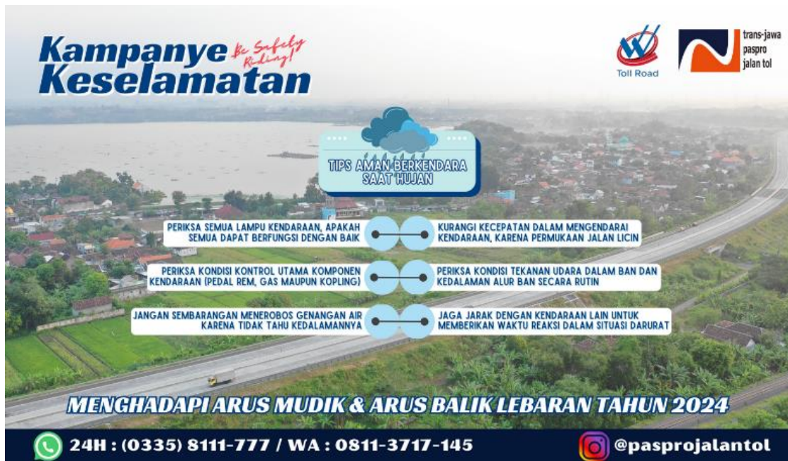
Gambar 3. Stiker Tips Aman Berkendara Saat Hujan