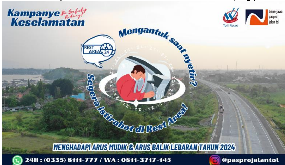
Gambar 4. Stiker Himbauan untuk Istirahat di Rest Area

Stiker yang sudah di desain kemudian akan dicetak lalu dibagikan kepada pengguna jalan tol Pasuruan – Probolinggo dan diharapkan dari kegiatan kampanye keselamatan tersebut dapat meningkatkan kesadaran para pengguna jalan tol untuk mengemudikan kendaraannya dengan hati-hati dan juga agar selalu waspada terhadap kondisi dari diri masing-masing pengendara serta lebih mengutamakan