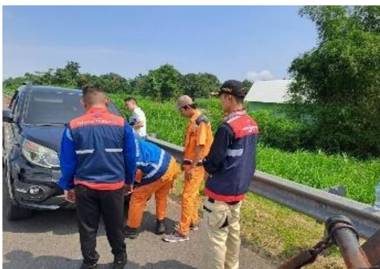
Gambar 8. Sosialisasi dan Pemberian Stiker Keselamatan