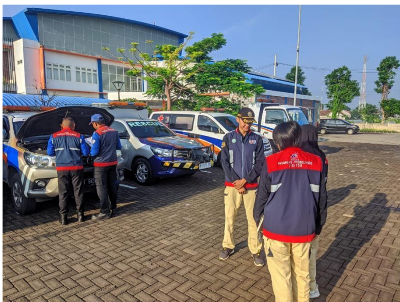
Gambar 7. Persiapan Sosialisasi Keselamatan