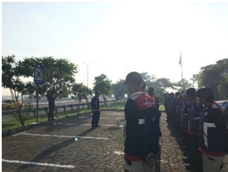
Gambar 6. Kegiatan Safety Talk