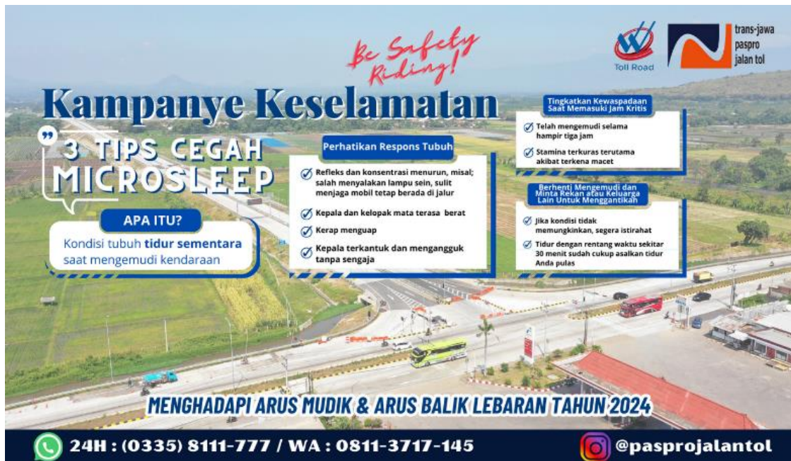
Gambar 1. Stiker Tips Cegah Microsleep