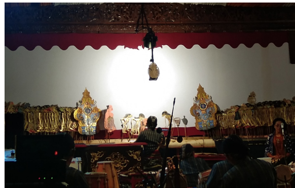
Gambar 2. Dèwi Sri menyarankan kepada Jaka Ipel, kakek, dan neneknya agar menggelar upacara wiwitan

Menggala dan saat ia mengubah wujudnya dari burung pipit yang memakan makanan Jaka Ipel. Setelah identitasnya terungkap, ia memberkati panen Jaka Ipel dan keluarganya dengan syarat mereka menggelar upacara wiwitan .