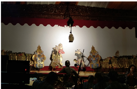
Gambar 4. Dèwi Sri dan Kebo Gèdhèg berpapasan dengan Prabu Kala Gumarang

balé wisma menjadi sebuah keraton, dan Raden Nurunan dinobatkan sebagai raja.