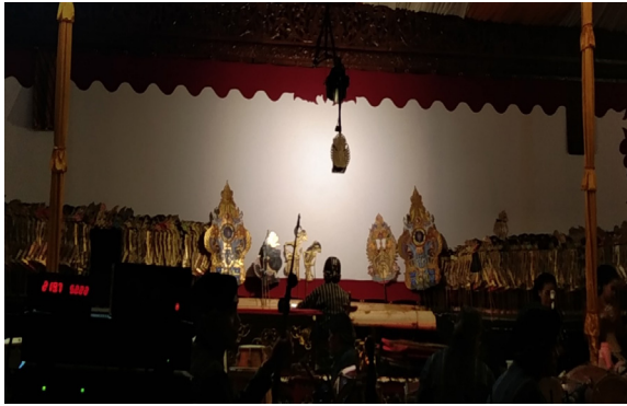
Gambar 3. Dèwi Sri dan Nurunan mendirikan balé wisma