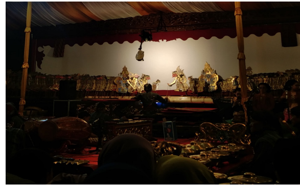
Gambar 1. Dèwi Sri diusir oleh Prabu Sengkan karena menolak dijodohkan dengan Prabu Kala Gumarang

Selama perjalanannya, Dèwi Sri berinteraksi dengan berbagai karakter. Ia berhasil melarikan diri dari upaya penjemputan paksa oleh Gadhing Winukir, yang dibantu oleh keempat anak angkatnya. Dèwi Sri juga tampil sebagai sosok sakral yang terkait dengan kesuburan, seperti saat ia muncul dari perut kerbau yang disiksa Cakra