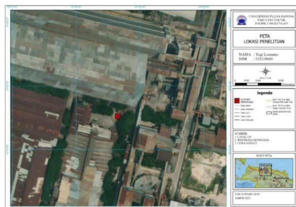
Gambar 1. Lokasi Pengambilan Sampel

Penelitian ini dilaksanakan pada air limbah domestik yang bersumber dari salah satu perusahaan di Cikarang Barat, dengan pengambilan sampel terfokus pada titik inlet sebelum perlakuan. Analisis kualitas air dan uji perlakuan dilakukan di Laboratorium Teknik Lingkungan Universitas Pelita Bangsa, sedangkan pengujian pembandingan dilakukan di Perum Jasa Tirta II. Waktu pelaksanaan penelitian mencakup tahap persiapan, pengambilan sampel, pengujian laboratorium, analisis data, hingga penyusunan laporan. Adapun lokasi pengambilan sampel dapat dilihat pada Gambar Lokasi Pengambilan Sampel yang disajikan dibawah ini.