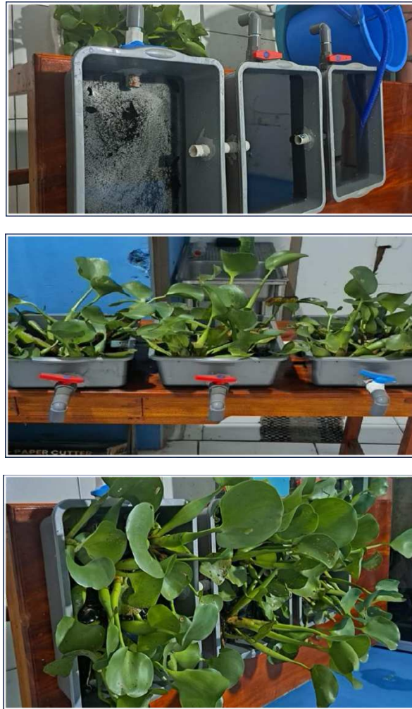
Gambar 4. Desain Proses Fitoremediasi

Karakteristik awal air limbah domestik (hari ke-0) menunjukkan nilai TSS sebesar 283 mg/L, BOD 154 mg/L, COD 257 mg/L, dan pH 6,41, di mana sebagian parameter melebihi baku mutu yang ditetapkan. Setelah perlakuan hari ke-1, terjadi penurunan konsentrasi TSS menjadi 148 mg/L, BOD 116 mg/L, dan COD 179 mg/L, sementara pH meningkat menjadi 7,28. Penurunan ini menunjukkan bahwa proses fitoremediasi mulai bekerja sejak 24 jam pertama. Data lengkap karakteristik awal dan hasil uji hari ke-1 dapat dilihat pada Tabel Hasil Pengujian Sampel dan Tabel Hasil Uji Hari ke-1 berikut ini.