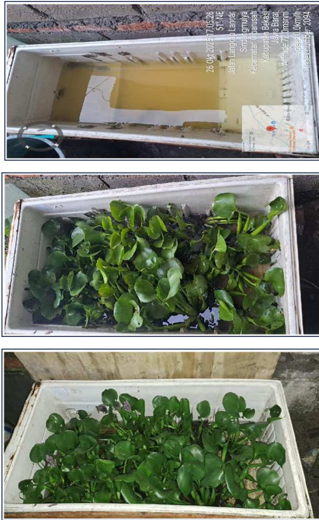
Gambar 3. Bak Aklimatisasi

Selama proses fitoremediasi tiga hari, setiap reaktor diisi lima tanaman dengan kondisi daun yang diamati secara berkala. Pada hari pertama daun masih dominan hijau, sedangkan pada hari kedua dan ketiga mulai terlihat perubahan warna menjadi kekuningan yang mengindikasikan adanya respons fisiologis terhadap paparan limbah. Meskipun terjadi perubahan warna, tanaman tetap mampu menjalankan fungsi penyisihan polutan secara optimal. Desain sistem terdiri atas tiga reaktor dengan sistem sirkulasi menggunakan pompa dan pipa sehingga proses berlangsung secara kontinu. Rincian pengamatan proses disajikan pada Tabel Proses Fitoremediasi dan ilustrasi sistem dapat dilihat pada Gambar Desain Proses Fitoremediasi dibawah ini.