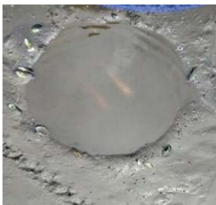
Gambar 2. Sarang pemijahan

suhu terlalu tinggi yang akan mengakibatkan stres pada induk (Sumarni, 2018; Hidayat, 2018). Pemijahan ikan nila merah nilasa di UKBAT Cangkringan dilakukan secara alami yaitu dengan menempatkan induk jantan dan betina di dalam satu unit kolam pemijahan. Ikan nila merah nilasa bisa memijah sepanjang tahun di daerah tropis (Sumarni, 2018). Pemijahan ikan dilakukan secara massal dan pasangan dengan perbandingan 1:3. Pemijahan alami diawali dengan induk jantan membuat sarang pemijahan berdiameter 30-50 cm (Gambar 2), selanjutnya induk betina akan mendiami sarang yang telah dibuat oleh induk jantan sampai induk jantan menghampiri induk betina dan terjadi proses pemijahan (induk betina mengeluarkan telur dan induk jantan mengeluarkan sperma). Proses pemijahan ikan nila merah nilasa berlangsung sangat cepat. Menurut Sumarni (2018), dalam waktu 50 sampai 60 detik ikan betina mampu menghasilkan 20-40 butir telur yang telah dibuahi. Pemijahan ikan nila merah nilasa terjadi beberapa tahap dengan pasangan yang sama atau berbeda. Selanjutnya, telur akan dierami di dalam mulut induk betina. Induk betina bersifat mouth breeder (mengerami telur di dalam mulut). Induk betina yang sedang mengerami telur akan terlihat membesar pada bagian mulutnya (Sumarni 2018).