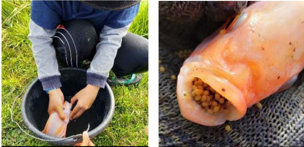
Gambar 3. Pemanenan telur: (a) pemanenan telur, (b) telur pada mulut induk