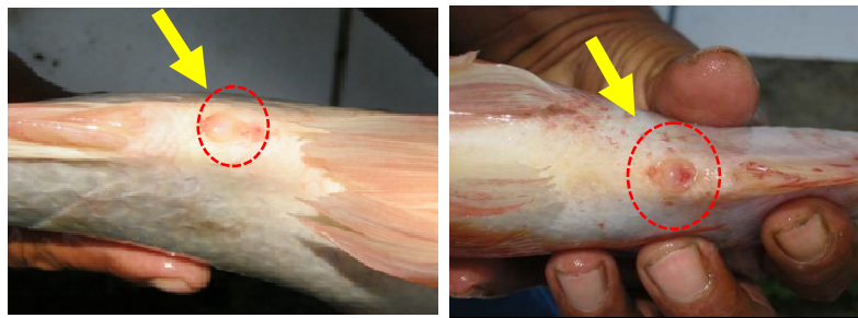
Gambar 1. Seleksi induk: (a) induk jantan, (b) induk betina

Calon induk yang diseleksi berasal dari stok induk yang ada di UKBAT Cangkringan. Menurut Sumarni (2018), seleksi induk bertujuan untuk memilih induk yang memiliki kualitas baik untuk dipijahkan, sehingga dapat menghasilkan kualitas dan kuantitas telur yang baik. Induk diseleksi secara manual dengan visualisasi melalui perbedaan bentuk tubuh, organ genital, warna tubuh ikan jantan dan ikan betina serta pemeriksaan kesehatan ikan yang diseleksi. Bobot induk betina berkisar 300-400 g/ekor, sedangkan bobot induk jantan berkisar 400-500 g/ekor. Perbedaan induk nila merah nilasa jantan dan betina dapat dilihat dari morfologinya yaitu ukuran tubuh, jumlah lubang pada bagian anal dan warna tubuh induk. Ciri-ciri induk jantan (Gambar 1a) memiliki bentuk tubuh besar dan membulat, warna tubuh lebih cerah, organ genital berupa tonjolan kecil dan meruncing, serta mulut lebih lebar. Ada pun ciri-ciri induk betina (Gambar 1b) memiliki bentuk tubuh lebih kecil dan memanjang, warna tubuh pudar, organ genital berbentuk cekung, serta mulut lebih kecil.