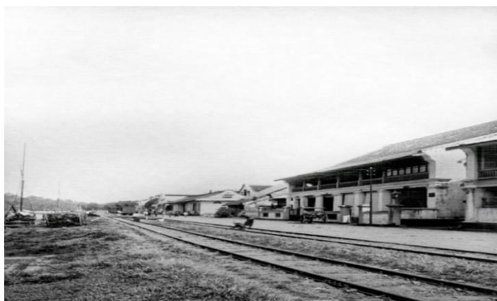
Gambar 1. Jalan Batang Arau, Kota Tua Padang

Berdasarkan teori yang K. Ansell dan G. Gash (2008) bangun, destinasi wisata akan berhasil jika para aktor yang berperan aktif menjalin sinergi. Aktor-aktor tersebut yaitu pemerintah, masyarakat, dan pihak swasta. Model yang dibuat meyakini bahwa kolaborasi menjadi hal yang perlu ada dalam pengambilan keputusan dan manajemen. Pariwisata budaya pun mempercayai hal yang sama. Jafari (2018) menyatakan pengelolaan destinasi budaya yang sukses harus mempertimbangkan kebijakan yang bersifat kolaboratif. Karena itu, pengelolaan destinasi wisata budaya Kota Tua Padang akan membutuhkan upaya strategis dari kolaborasi pemerintah pusat, pemerintah daerah, dan masyarakat.