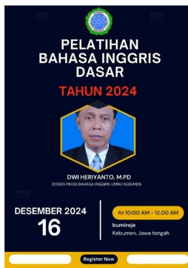
Gambar 1 Flyer Kegiatan

Pelatihan dilakukan pada hari senin, tanggal 16 Desember 2024 di SD Negeri 1 Bumirejo yang diikuti oleh kelas 4 sd 6 sebanyak 63 siswa.