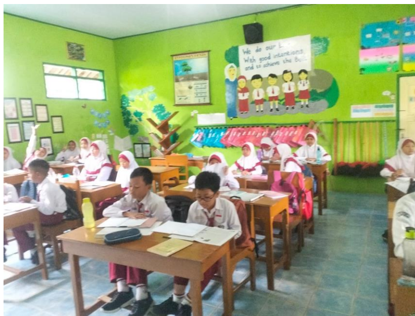
Gambar 2 Kegiatan Pelatihan