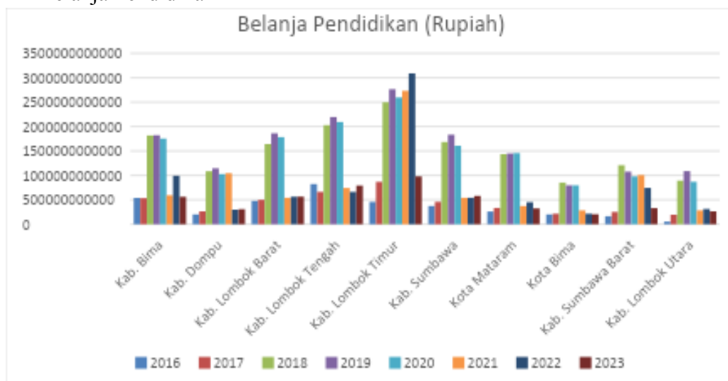
Grafik 1 Belanja Pendidikan

Bagian hasil ini akan dipaparkan hasil penelitian dan analisis mendalam terhadap pengaruh belanja pemerintah daerah di Nusa Tenggara Barat terhadap Pembangunan bidang Pendidikan selama periode 2016 hingga 2023. Adapun realisasi belanja Pendidikan yang dilakukan 10 pemerintah daerah kabupaten/kota di Nusa Tenggara Barat ditunjukkan oleh grafik dibawah ini: