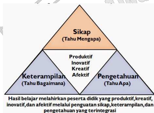
Gambar : 1.1 Integrasi Pembelajaran Saintifik

pembelajaran yang terdiri atas kegiatan mengamati (untuk mengidentifikasi hal-hal yang ingin diketahui), merumuskan pertanyaan (dan merumuskan hipotesis), mencoba/mengumpulkan data (informasi) dengan berbagai teknik, mengasosiasi/menganalisis/mengolah data (informasi) dan menarik kesimpulan serta mengkomunikasikan hasil yang terdiri dari kesimpulan untuk memperoleh pengetahuan, keterampilan dan sikap. Langkah-langkah tersebut dapat dilanjutkan dengan kegiatan mencipta.