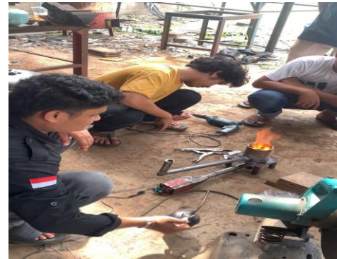
Gambar 1. Hasil uji alat setelah jadi

Pengujian dilakukan dengan melakukan variasi jumlah lubang bunner 16 lubang, 20 lubang, 24 lubang [5]. Adapun data yang diambil dari penelitian ini yaitu jumlah bahan bakar yang digunakan, warna nyala api dan temperatur pembakaran serta efisiensi kompor. Pengujian kompor dilakukan dengan variasi laju aliran udara 9 m/s, 10 m/s, dan 11 m/s [6].