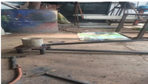
Gambar 4. Bentuk alat setengah jadi masih perlu beberapa perbaikan yaitu pengelasan, pemotongan, dan finising

Pada tahap evaluasi, peserta antusias mengikuti pelatihan. Berdasarkan diskusi selama pelatihan dilaksanakan, diketahui bahwa sebagian besar peserta baru mengetahui bahwa oli motor bekas dapat dimanfaatkan dengan dibakar langsung. Proses pembuatan tungku terasa sulit pada awalnya, namun menjadi mudah ketika dilakukan berulang-ulang [10].