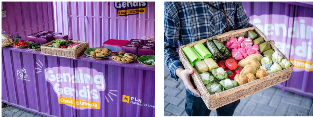
Gambar 3. Produk UMKM Gending Gendis yang Dijajakan Setiap Hari