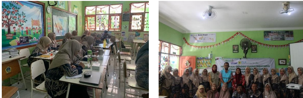
Gambar 5. Aktivitas Kemitraan Pelatihan Gender Mainstreaming di Sekolah dan KUA

Pelaksanaan Program ASA BERGENDING tidak terlepas dari partisipasi aktif masyarakat dan kolaborasi lintas sektor, contohnya adalah kolaborasi dengan Pusat Krisis dan Pengembangan Komunitas (PKPK) UNAIR dengan bersama-sama aktif dalam edukasi dan pemberdayaan masyarakat terkait isu gender dan KDRT. PKPK memberikan pelatihan kepada murid, guru, modin, penyuluh, dan petugas KUA tentang kesetaraan gender, pencegahan KDRT, serta komunikasi yang sehat. Selain itu, PKPK memberikan layanan konseling bagi penyintas, serta menjadi pemateri dalam pelatihan manajemen stres, self love , trauma releasing , dan komunikasi efektif-asertif.