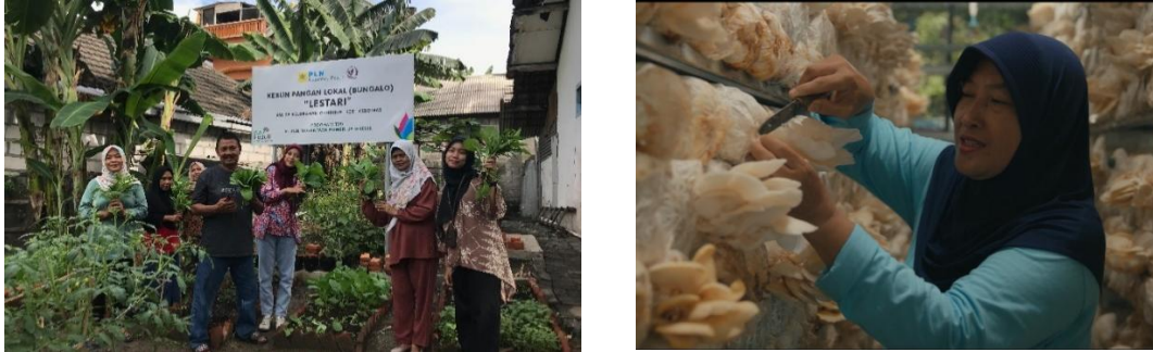
Gambar 2. Aktivitas Eco Healing Penyintas di Bungalo, Greenhouse , dan Kumbung Jamur

pengecehan kekerasan untuk guru dan murid, serta implementasi modul pengarusutamaan gender dalam lingkungan sekolah. PT PLN Nusantara Power UP Gresik juga membentuk Gending Kids Club sebagai ruang aman bagi anak-anak untuk berinteraksi, belajar, dan memahami nilai-nilai kesetaraan gender sebagai upaya pencegahan kekerasan sejak dini.