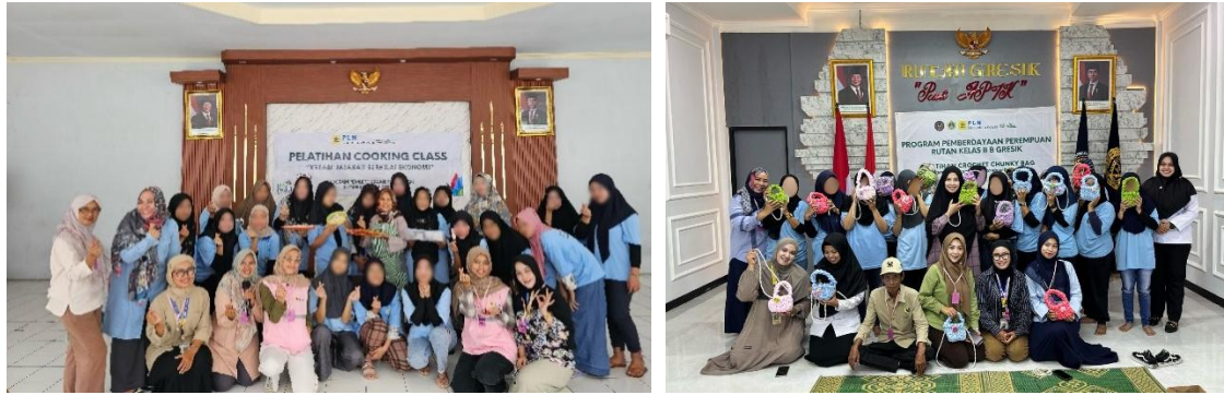
Gambar 6. Aktivitas Pemberdayaan WBPP oleh Penyintas Berdaya ASA BERGENDING

Kegiatan ini merupakan tindak lanjut dari terjalannya nota kesepahaman (MoU) antara perusahaan dengan Dinas KBPPPA Kabupaten Gresik, yang memperkuat sinergi dalam upaya pemberdayaan perempuan dan pemulihan penyintas kekerasan.