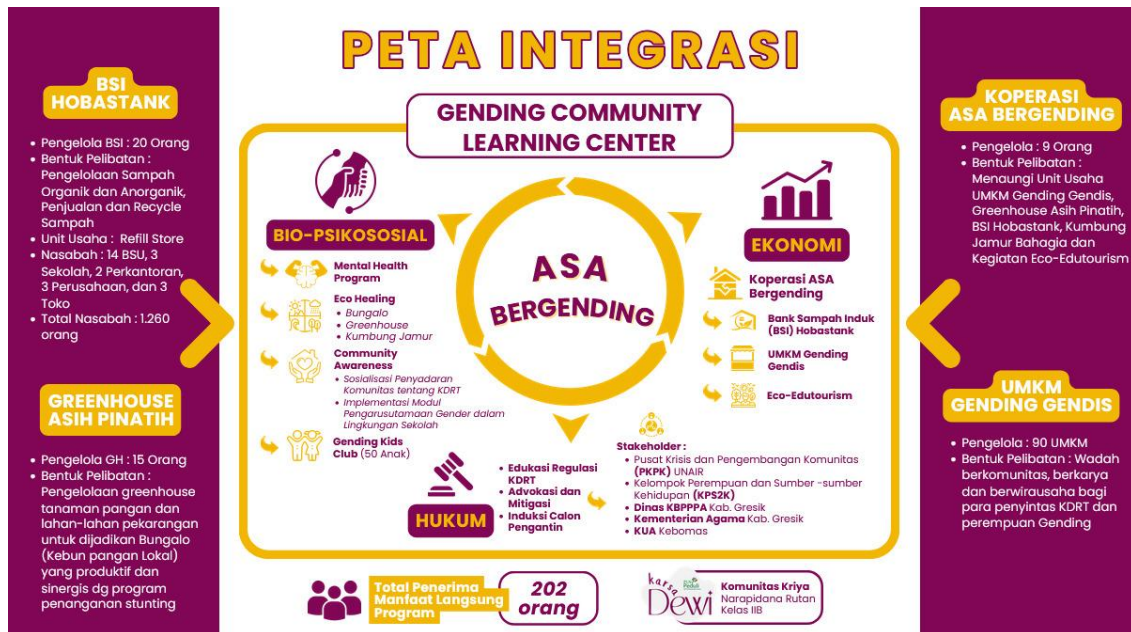
Gambar 1. Infografis Peta Integrasi Program ASA BERGENDING

Dari berbagai aktivitas program pada aspek bio-psikososial, ekonomi dan hukum yang telah dilaksanakan maka kegiatan yang dapat dikelompokkan ke dalam aspek model ekonomi BCG antara lain adalah: