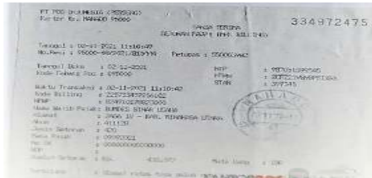
Gambar 3. Bukti Penyetoran Masa September 2021