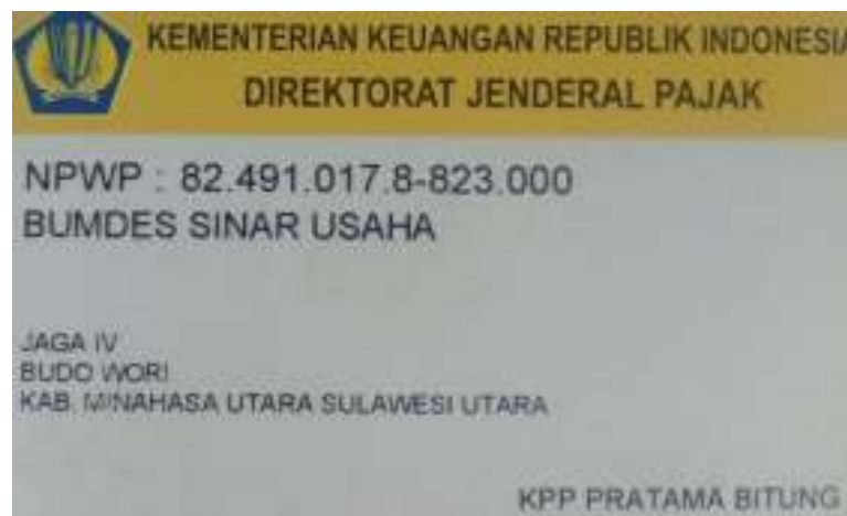
Gambar 1. NPWP Bumdes Sinar Usaha

Sebagai Badan Usaha yang menjalankan kegiatan perekonomian dan mendapatkan penghasilan sudah seharusnya sebagai warga negara yang berpenghasilan dan yang disahkan dengan kepemilikan Nomor Pokok Wajib Pajak atau di singkat NPWP .