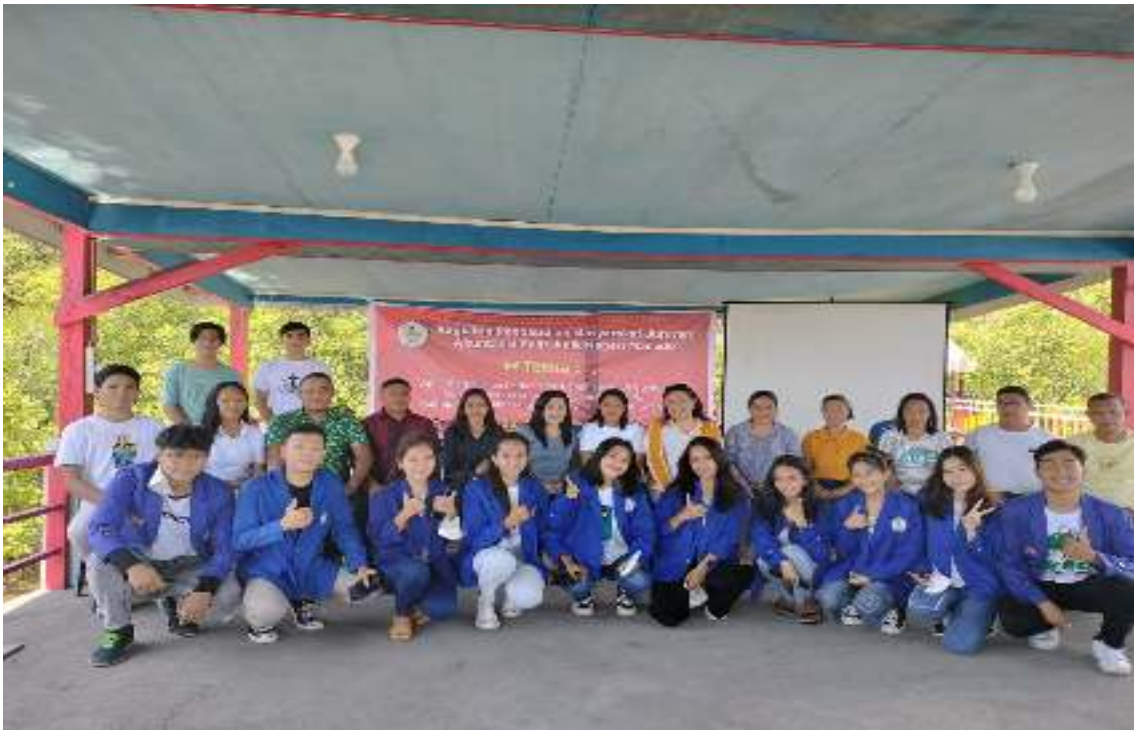
Gambar 4. Saat Selesai Workshop untuk cara perhitungan pajak

Untuk mendapatkan hasil yang maksimal kami melakukan pelatihan bahkan pendampingan untuk perhitungan pajak yang ada dan langsung di praktek dimana untuk pembayaran pajak bulan Oktober , November dan Desember tahun 2021 akan langsung di bayarkan sesuai dengan perhitungan yang kami buat berdasarkan olahan data yang ada.