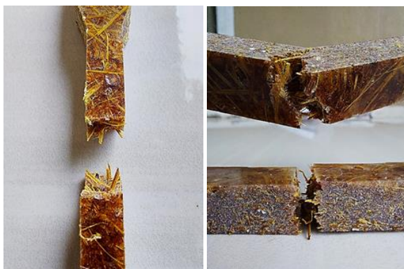
Gambar 3. Komposit Variasi 1

Patahan yang terjadi pada spesimen variasi 1 adalah patah getas ( brittle fracture ). Dimana, retakan terjadi secara cepat tanpa adanya deformasi plastis terlebih dahulu. Material yang mempunyai sifat getas dinilai cukup berbahaya karena dapat terjadi patah begitu saja tanpa disadari.