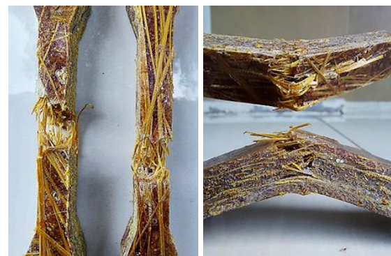
Gambar 5. Komposit Variasi 3

Patahan yang terjadi pada spesimen variasi 3 adalah patah ulet ( ductile fracture ). Dimana, retakan diawali dengan adanya deformasi plastis terlebih dahulu. Permukaan patah ulet mempunyai ciri nampak kasar dan juga berserabut ( fibrous ). Patah ulet dinilai lebih aman karena berlangsung secara perlahan dan jika beban dihilangkan maka penyebaran patahan akan berhenti.