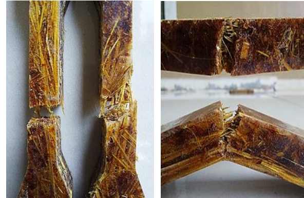
Gambar 4. Komposit Variasi 2

adanya deformasi plastis terlebih dahulu. Material yang mempunyai sifat getas dinilai cukup berbahaya karena dapat terjadi patah begitu saja tanpa disadari.