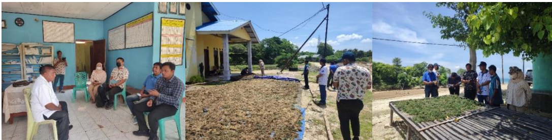
Dokumentasi Kegiatan Survey Tahap I