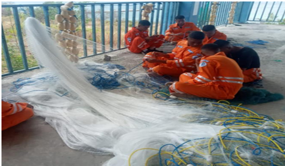
Gambar. Perakitan Alat tangkap Gill Net Dasar Monofilament