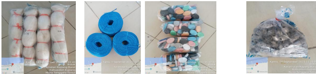
Gambar Bahan dan Material pendukung Gill Net Dasar Monofilament