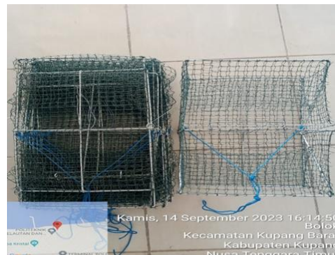
Gambar alat tangkap bubu lipat siap operasi