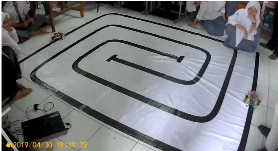
Gambar 4. Lomba robot line follower