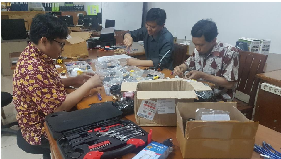
Gambar 2. Persiapan peralatan dalam rangka pengabdian masyarakat