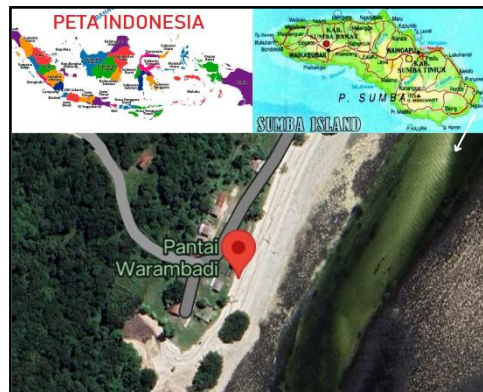
Gambar 1. Peta Lokasi Pantai Warambadi (Sumber: Google Maps)

dan kimia dilakukan di lokasi penelitian. Identifikasi kerang dilakukan di laboratorium biologi Universitas Kristen Wira Wacana Sumba.