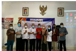
Gambar 3. Sosialisasi Hasil Pembuatan Inovasi Produk Terasi

Manfaat yang didapat dalam kegiatan Pengabdian Masyarakat pada Desa Rawagempol Kulon dengan pelatihan dan pendampingan inovasi produk sebagai berikut: