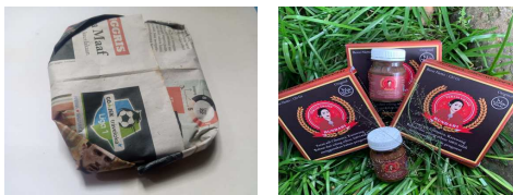
Gambar 2. Produk Inovasi