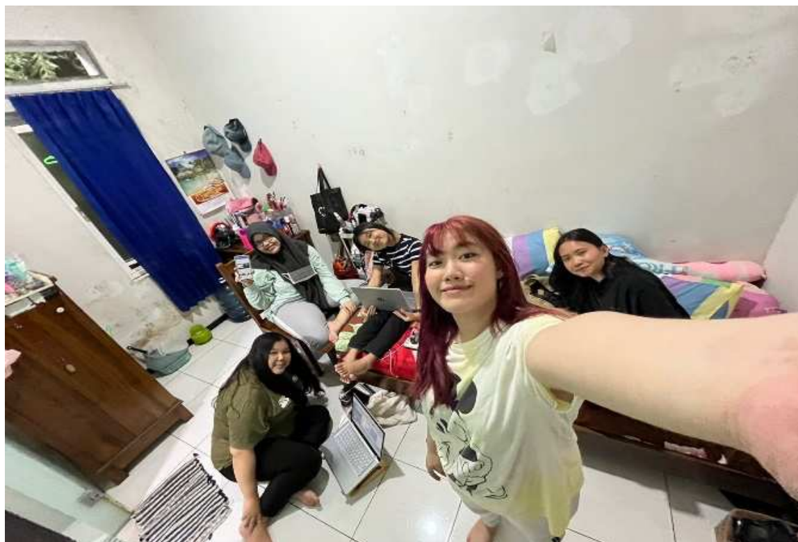
Gambar 2. Proses pembuatan materi PkM