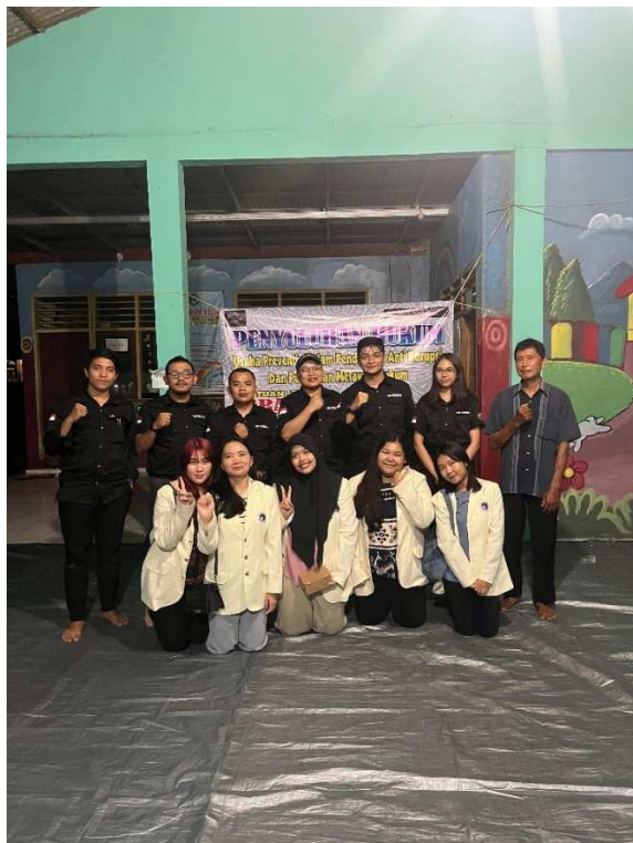
Gambar 6. Tim pengabdian Masyarakat