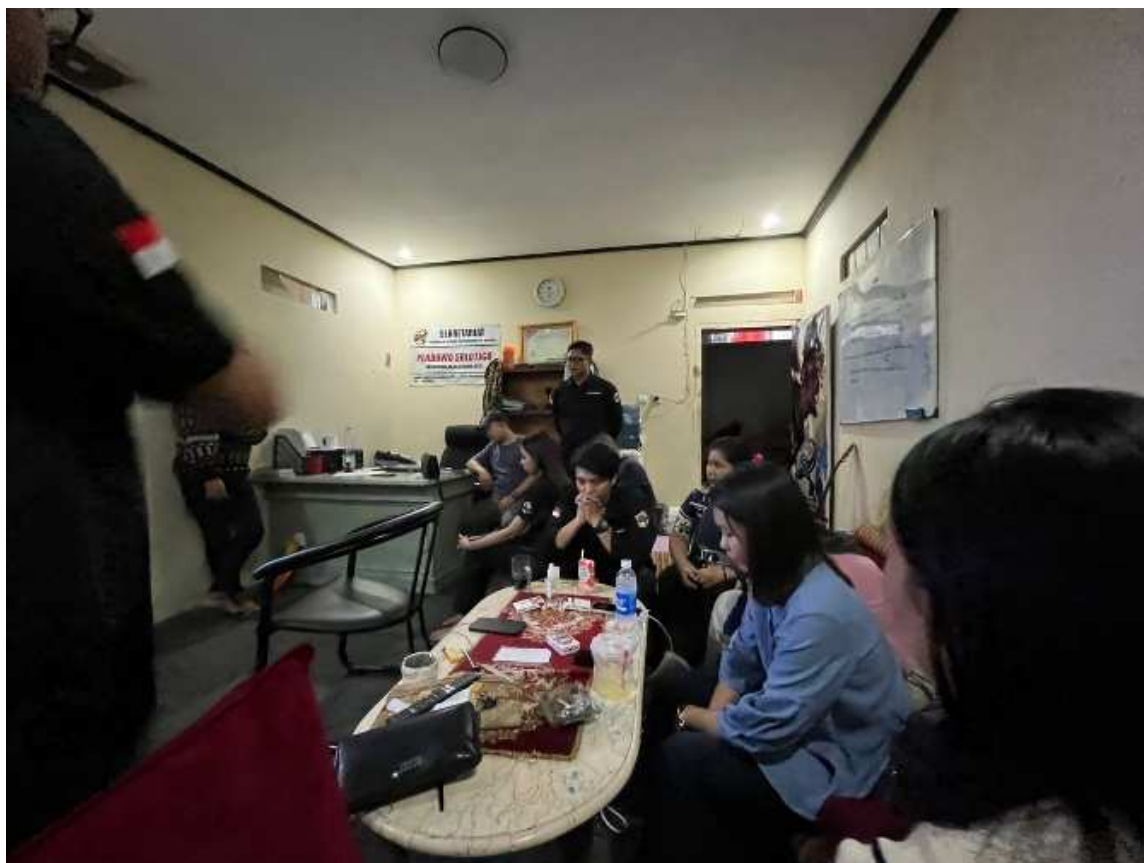
Gambar 1. Diskusi materi PKM