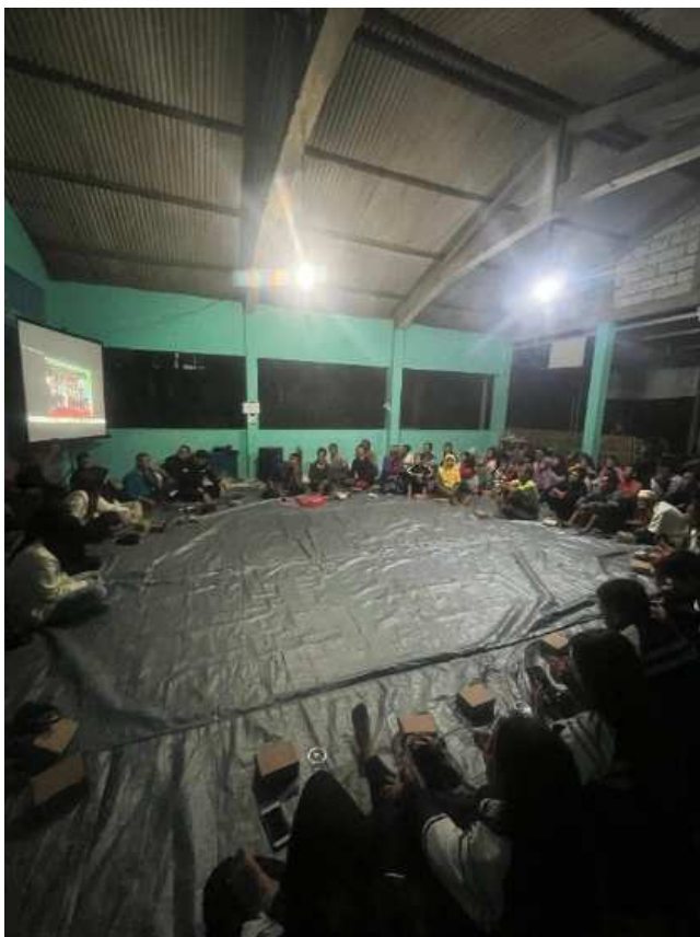
Gambar 4. Sesi sharing dengan masyarakat