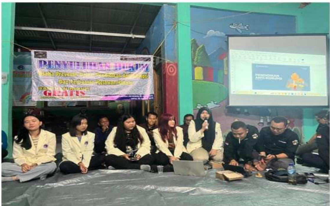
Gambar 3. Penyampaian materi PkM