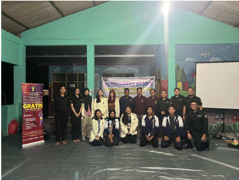
Gambar 5. Pelaksanaan kegiatan