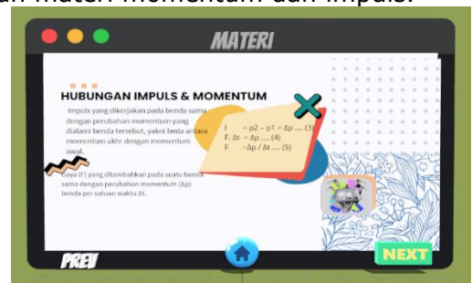
Gambar 2. Materi media pembelajaran

Materi yang digunakan pada media pembelajaran yang telah dikembangkan adalah materi momentum dan impuls.