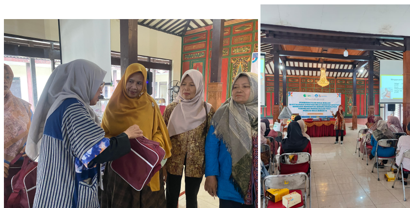
Gambar 5. Sosialisasi PKD dan Sosialisasi KWT

Pos Kesehatan Desa (PKD) merupakan organisasi fungsional yang menyelenggarakan upaya kesehatan yang bersifat menyeluruh, terpadu, merata, dapat diterima dan terjangkau oleh masyarakat, dengan peran serta aktif masyarakat dan menggunakan hasil pengembangan ilmu pengetahuan dan teknologi tepat guna, dengan biaya yang dapat dipikul oleh pemerintah dan masyarakat. Upaya kesehatan tersebut diselenggarakan dengan menitikberatkan kepada pelayanan untuk masyarakat luas guna mencapai derajat kesehatan yang optimal, tanpa mengabaikan mutu pelayanan kepada perorangan. Pos Kesehatan Desa (PKD) berfungsi sebagai unit pelayanan primer di tingkat desa yang memfasilitasi deteksi dini, edukasi kesehatan, dan rujukan sederhana untuk masalah gizi dan pertumbuhan anak. Kegiatan sosialisasi yang diselenggarakan melalui PKD meliputi pelatihan kader, penyuluhan gizi, dan pemutaran media edukasi terbukti meningkatkan pengetahuan dan keterampilan kader dalam pelaksanaan program pencegahan stunting dan program gizi lainnya. Pelatihan kader posyandu atau PKD yang berfokus pada kelas balita dan praktik stimulasi tumbuh kembang dilaporkan meningkatkan skor pengetahuan dan keterampilan kader secara signifikan, sehingga kemampuan deteksi dini dan intervensi lokal menjadi lebih efektif (Purnama Eka Sari et al., 2022). Gambar 5 merupakan sosialisasi PKD dan KWT.