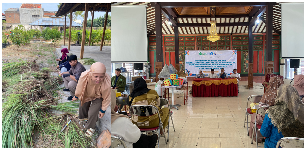
Gambar 2. Panen TOGA dan Sosialisasi Program Kerja

strategi pemasaran produk herbal. Studi JIPEMAS di Dusun Ngelosari menunjukkan bahwa pendirian “Taman TOGA percontohan” sekaligus pelatihan budidaya, pasca-panen, pengemasan, dan pemasaran secara terpadu memungkinkan KWT menghasilkan produk jamu yang berkualitas dan menjadikannya sebagai model sinergi antara konservasi dan kesehatan masyarakat (Rahardjo et al., 2022). Gambar 2 merupakan panen TOGA dan sosialisasi program kerja.