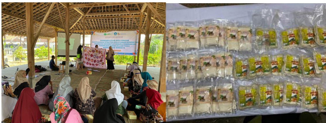
Gambar 6. Penerapan Edukasi dan Hasil Olahan Pangan Jaselor serta Nugget Kelor

Metode edukasi mengenai stunting juga berkembang. Sebelumnya, edukasi hanya dilakukan secara verbal dengan bantuan leaflet, tanpa adanya inovasi dalam menu tambahan. Setelah program, kader sudah dapat