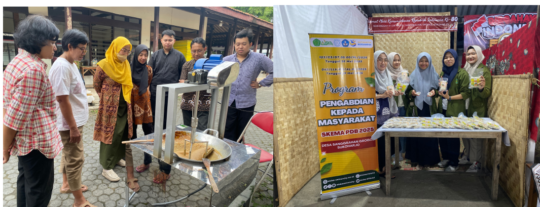
Gambar 3. Produksi Toga dan Expo UMKM

Gambar 3 merupakan produksi TOGA dan expo UMKM. Kemampuan produksi juga menunjukkan peningkatan. Sebelumnya, keterampilan anggota dalam menciptakan produk dari jahe, serai, dan kelor masih rendah (73%), cukup 15%, dan baik 12%. Setelah mendapat pendampingan, sebagian besar anggota menunjukkan kemampuan yang baik (73%), cukup 15%, dan hanya 18% yang masih rendah. Tabel 2 menunjukkan tingkat keterampilan produksi sebelum dan sesudah pendampingan.