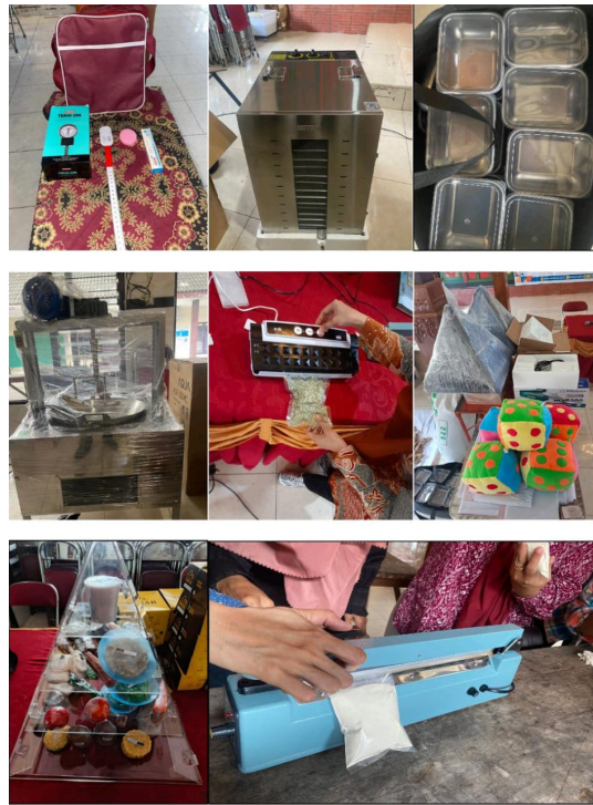
Gambar 4. Alat KWT dan PKD

Pos Kesehatan Desa (PKD) merupakan organisasi fungsional yang menyelenggarakan upaya kesehatan yang bersifat menyeluruh, terpadu, merata, dapat diterima dan terjangkau oleh masyarakat, dengan peran serta aktif masyarakat dan menggunakan hasil pengembangan ilmu pengetahuan dan teknologi tepat guna, dengan biaya yang dapat dipikul oleh pemerintah dan masyarakat. Upaya kesehatan tersebut diselenggarakan dengan menitikberatkan kepada pelayanan untuk masyarakat luas guna mencapai derajat kesehatan yang optimal, tanpa mengabaikan mutu pelayanan kepada perorangan. Pos Kesehatan Desa (PKD) berfungsi sebagai unit pelayanan primer di tingkat desa yang memfasilitasi deteksi dini, edukasi kesehatan, dan rujukan sederhana untuk masalah gizi dan pertumbuhan anak. Kegiatan sosialisasi yang diselenggarakan melalui PKD meliputi pelatihan kader, penyuluhan gizi, dan pemutaran media edukasi terbukti meningkatkan pengetahuan dan keterampilan kader dalam pelaksanaan program pencegahan stunting dan program gizi lainnya. Pelatihan kader posyandu atau PKD yang berfokus pada kelas balita dan praktik stimulasi tumbuh kembang dilaporkan meningkatkan skor pengetahuan dan keterampilan kader secara signifikan, sehingga kemampuan deteksi dini dan intervensi lokal menjadi lebih efektif (Purnama Eka Sari et al., 2022). Gambar 5 merupakan sosialisasi PKD dan KWT.