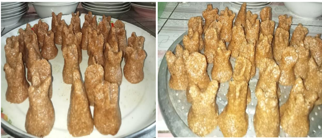
Gambar 1. Bentuk Kue Tradisional Halua Kenari

Bentuk dari halua kenari ini dibuat dengan versi mereka sendiri yang secara tidak langsung bentuk-bentuk dari halua kenari tersebut membentuk bangun geometri. Bentuk halua kenari itu sendiri dia bervariasi dari bentuk lingkaran dan persegi pada alas halua kenari, bentuk tabung dan balok di bagian tengah dan bentuk kerucut pada bagian permukaan halua kenari tersebut. Bentuk-bentuk tersebut dapat disajikan dalam gambar berikut: