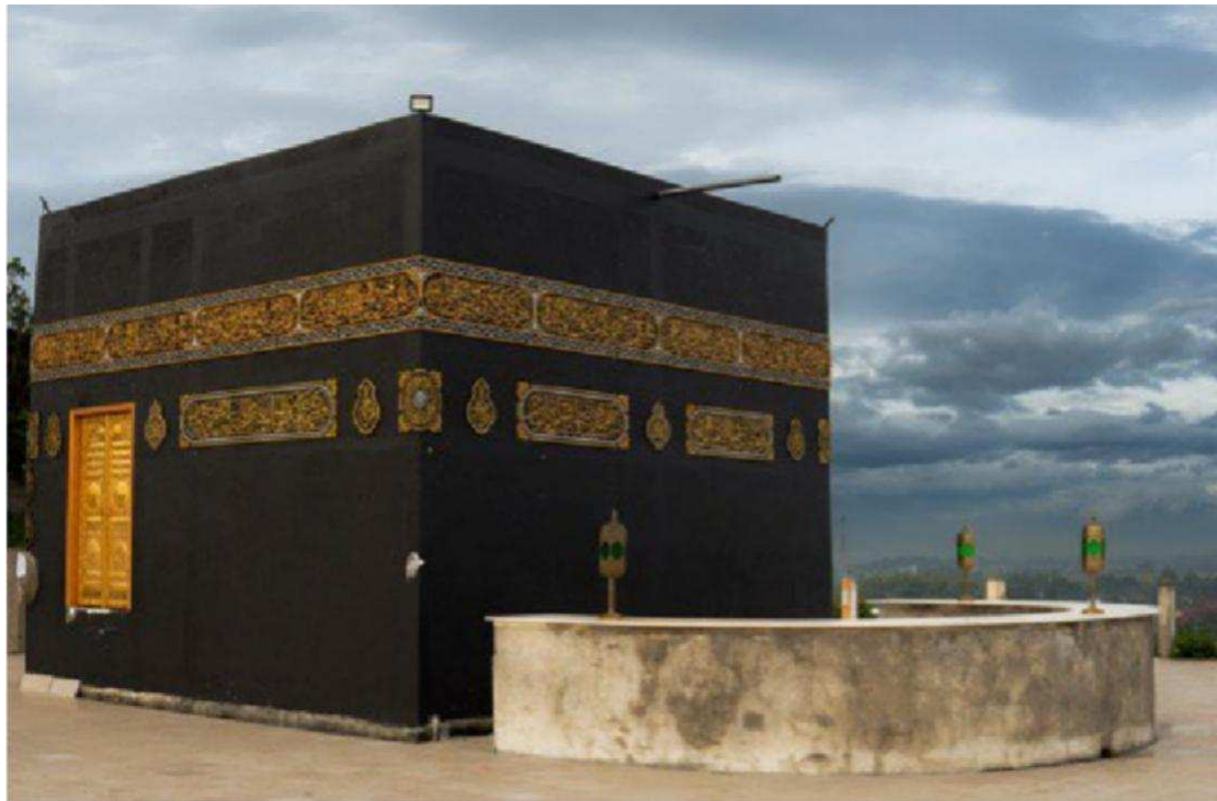
Gambar 2 Replika Ka'bah sebagai aset fisik utama wisata religi di Desa Campurdarat, Kabupaten Tulungagung

pembina program, yang memiliki otoritas strategis dalam pengambilan kebijakan pengembangan wisata religi. Replika Ka'bah sebagai aset fisik utama wisata religi tersebut ditunjukkan pada Gambar 2.