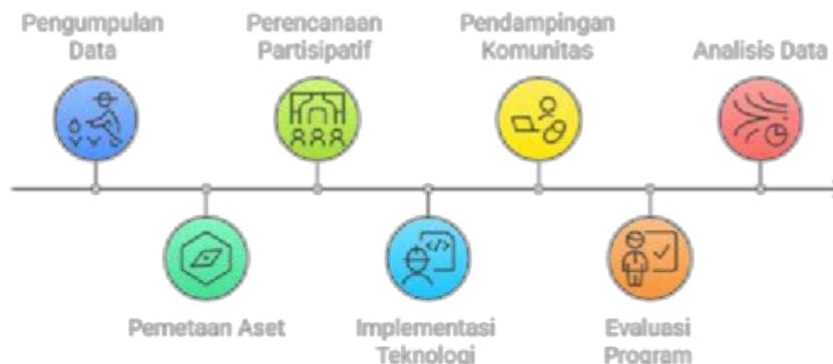
Gambar 1 Metodologi pendampingan wisata religi berbasis komunitas