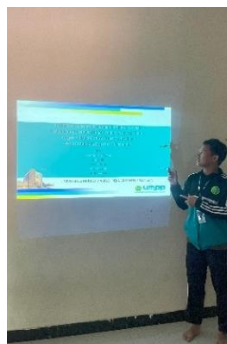
Gambar 1. Kegiatan edukasi manajemen keuangan keluarga sebagai upaya mengurangi ketergantungan “Bank Tongol” Di Dusun Sadran Puton

Selain itu, seluruh peserta berhasil menyusun rancangan keuangan keluarga sederhana yang mencakup pendapatan, pengeluaran rutin, kebutuhan mendesak, dan alokasi tabungan. Diskusi kelompok juga menunjukkan bahwa peserta mulai memahami pentingnya komunikasi keuangan dalam rumah tangga dan mempertimbangkan risiko berutang kepada bank tongol.