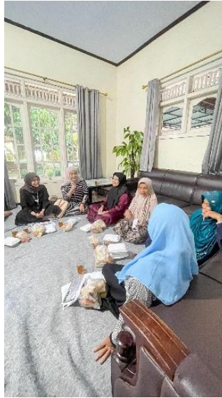
Gambar 2. Kegiatan edukasi manajemen keuangan keluarga sebagai upaya mengurangi ketergantungan “Bank Tongol” Di Dusun Sadran Puton