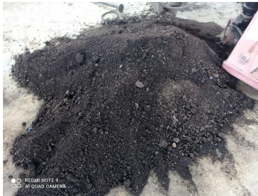
Gambar 2. Bahan Baku Janjang Kosong (Jankos) Sawit