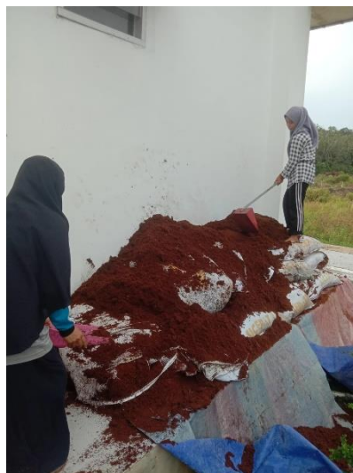
Gambar 3. Bahan Baku Cocopeat