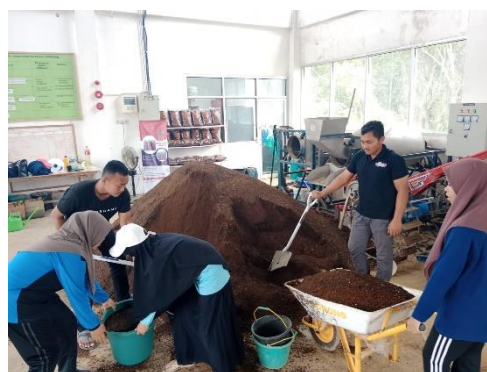
Gambar 6. Penyimpanan Bahan Jadi