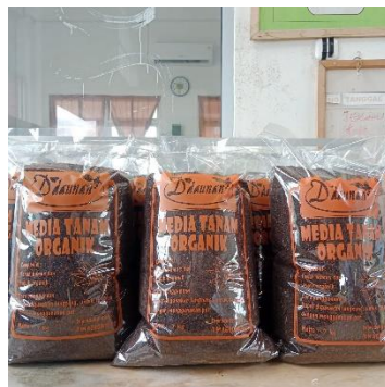
Gambar 8. Media Tanam Siap dipasarkan