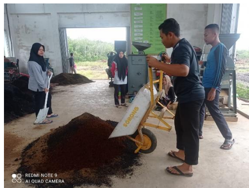
Gambar 4. Proses Pengabungan Semua Bahan