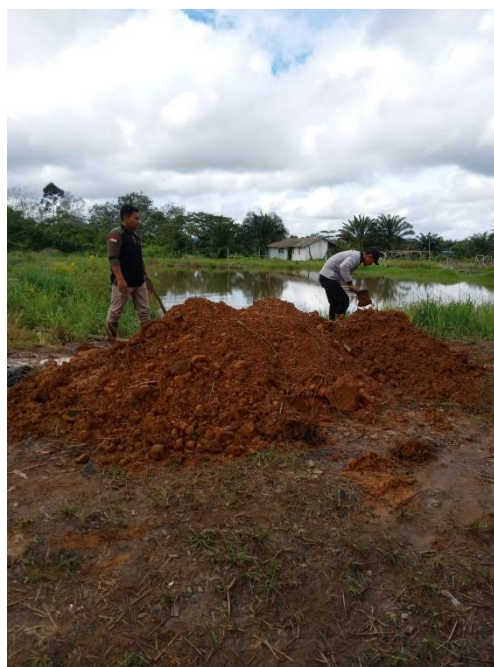
Gambar 1. Bahan Baku Tanah Humus

Pada tabel 1 dapat dilihat jumlah produksi hingga bulan November 2022. Selama proses produksi terdapat kendala dalam proses penjemuran bahan baku. Hal ini dikarenakan pada saat produksi terbentur kondisi cuaca musim hujan. Sehingga yang seharusnya bahan baku bisa kering dalam dua hari, menjadi lebih lama bisa mencapai 5 hari. Untuk itu perlu kiranya solusi untuk mempercepat proses pengeringan bahan, bisa dengan menggunakan lantai jemur ataupun dikeringkan menggunakan mesin.