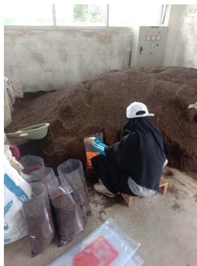
Gambar 7. Pengemasan Media Tanam