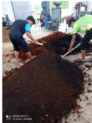
Gambar 5. Proses Pengadukan Bahan