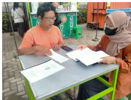
Gambar 5. Pelaksanaan Evaluasi Pelatihan

Sesi selanjutnya setelah pelatihan pengoperasian Aplikasi Buku Kas adalah sesi diskusi dan pendampingan langsung kepada pelaku UMKM untuk mengatasi permasalahan yang mungkin di temukan selama kegiatan pelatihan berlangsung. Pada awalnya dalam metode pelatihan ini tidak terdapat sesi diskusi dan pendampingan, namun jika hanya penjelasan saja maka peserta akan sulit memahami materi yang telah disampaikan, sehingga pemateri mengadakan sesi diskusi dan pendampingan langsung kepada peserta agar lebih maksimal dalam memahami pembuatan laporan keuangan.