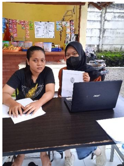
Gambar 3. Pelaksanaan Kegiatan Pelatihan

Pelatihan laporan keuangan sederhana menggunakan aplikasi Buku Kas ini dilakukan pada tanggal 6-9 Februari 2023 dan tahap evaluasi pada tanggal 14 dan 17 Februari 2023. Pelatihan diawali dengan memberikan penjelasan kepada pelaku UMKM mengenai manfaat dan tujuan pembuatan laporan keuangan bagi UMKM. Setelah itu dilanjutkan dengan penjelasan mengenai bagaimana langkah langkah penyusunan laporan keuangan sederhana. Kemudian memberikan pelatihan pengoperasian Aplikasi Buku Kas untuk mempermudah para pelaku UMKM dalam menyusun laporan keuangan sederhana.