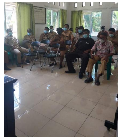
Gambar 4. Sosialisasi produk speed bump