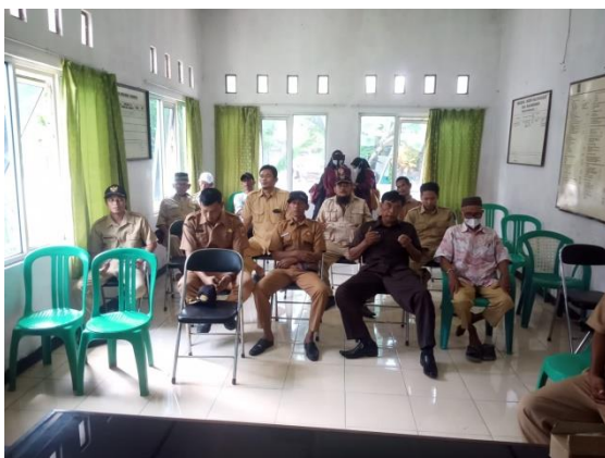
Gambar 5. Sosialisasi penggunaan, perawatan dan perbaikan sederhana speed bump