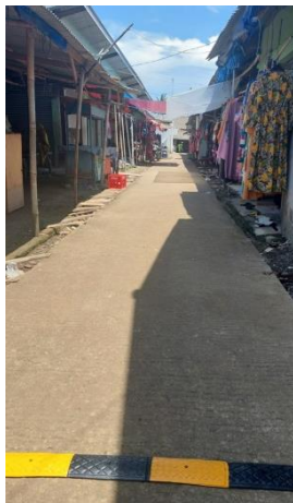
Gambar 4. Pemasangan speed bump di jalan