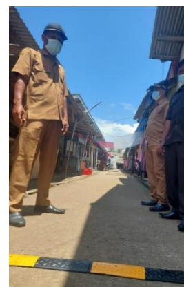
Gambar 6. Penyerahan produk speed bump